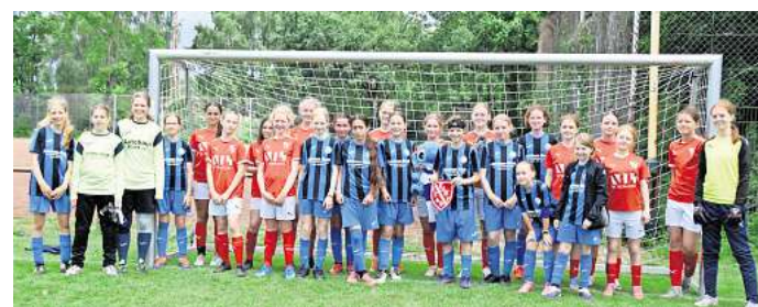
Fair Play über Ländergrenzen hinweg: Nach dem Spiel um Platz neun posieren die D-Juniorinnen der SG Everloh-Ditterke gemeinsam mit dem dänischen Team Eyb IF 1968.

Die Skelette werden derzeit von Archäologen untersucht. Nach bisherigen Erkenntnissen könnten sie vor rund 1000 Jahren bestattet worden sein. Wie alt die Skelette tatsächlich sind, welche historische Bedeutung sie haben und ob sie mit weiteren bekannten Fundstellen in Gehrden zusammenhängen, ist derzeit noch unklar.