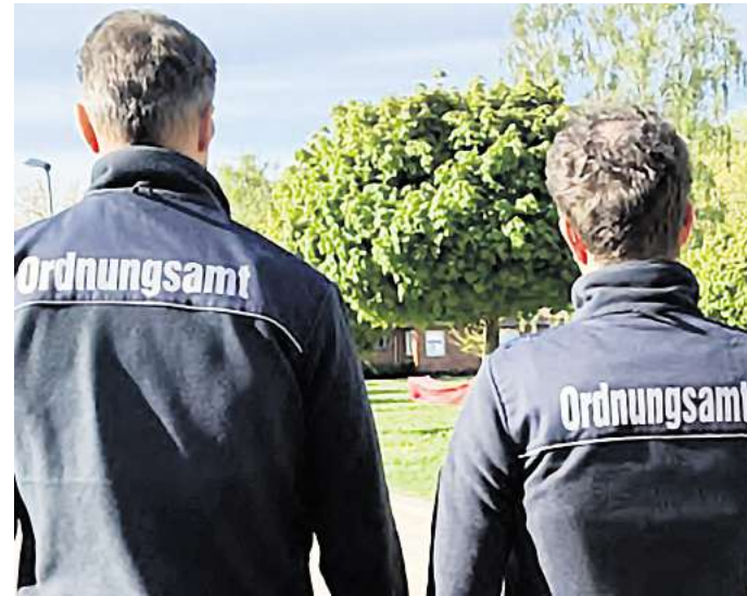
In der Stadt unterwegs: Zu zweit gehen die Mitarbeiter des Kommunalen Ordnungsdienstes in den Ortsteilen täglich auf Streife.

Zwei städtische Mitarbeiter sind jeden Tag in den Ortsteilen unterwegs, teils zu Fuß, teils in einem von der Stadt eigens dafür angeschafften Fahrzeug. Dabei sind die Streifen vormittags und nachmittags aktiv, zweimal pro Woche auch bis 20 Uhr. Dabei sollen sie nicht nur Verstöße aufnehmen, sondern mit ihrer Präsenz auch potenziellen Verstößen vorbeugen, berichtet Rohland. Das Team wird von zwei weiteren Mitarbeitern komplettiert. Einer ist für die Bearbeitung der Fälle im Innendienst zuständig, der andere für Kontrollen abgemeldeter Pkw, Adressermittlungen, den Zeugendienst und weitere Aufgaben.