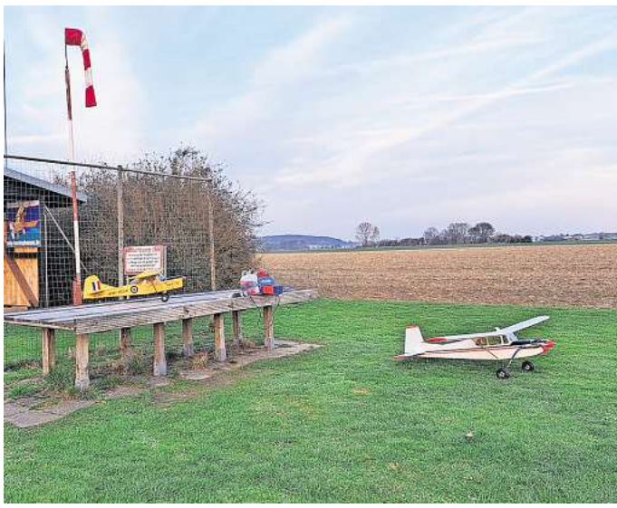
Es kann losgehen: Die Modellfluggruppe Barsinghausen startet in die Flugsaison.

Barsinghausen. Die Modellfluggruppe (MFG) Barsinghausen lädt für Sonntag, 7. Juni, in der Zeit von 13 bis 18 Uhr zum Tag des Modellflugs ein. „Wir möchten unseren Gästen die Faszination fürs Modellfliegen vermitteln“, sagt der MFG-Vorsitzende Ulrich Schulz. Die Vereinsmitglieder planen anlässlich dieses bundesweiten Aktionstages kostenloses Schnupperfliegen, Flugschows mit unterschiedlichen Fliegern, Technik zum Anfassen und einen Flugsimulator zum Selberfliegen. Es gibt Verpflegung vor Ort. Die Zufahrt zum Modellflugplatz östlich von Egestorf. Alle Details zur Lage des Platzes und zum Verein gibt es im Internet unter mfg-barsinghausen.de . (RED)