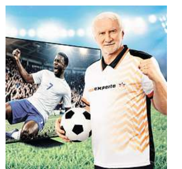
Fußball-Legende Rudi Völler wirbt für das Expert-Versprechen.

Die Aktion gilt für alle Fernseher, die vom 5. bis 10. Juni 2026 in teilnehmenden expert-Märkten gekauft werden. Voraussetzung für die Teilnahme ist die Registrierung der Verkaufsrechnung unter www.expert-wm.de . Alle Informationen und Teilnahmebedingungen finden Interessierte ebenfalls dort.