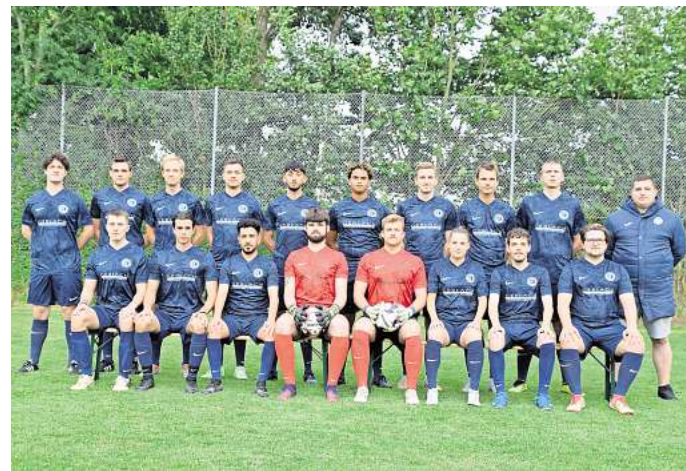
Erfolgreiche Spielzeit: Die Männer der SG Everloh-Ditterke steigen in die 3. Kreisklasse auf.

Auch die Frauenmannschaft der SG Everloh-Ditterke konnte sich den Meistertitel sichern. Damit stellte sie den dritten Titelgewinn für den Verein in dieser Spielzeit sicher.