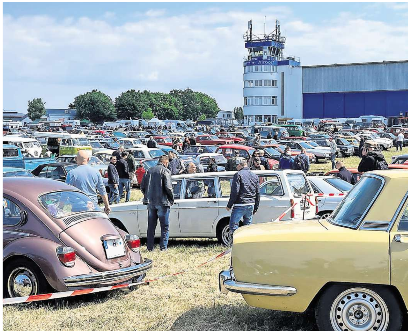
Technorama Hildesheim: ein Paradies für Oldtimer-Fans.

Ein besonderer Publikums-magnet ist der historische Motorsport. Rund 250 Fahrerinnen und Fahrer gehen auf dem 2,7 Kilometer langen Rundkurs an den Start und zeigen in elf Wertungsklassen Technikgeschichte in Bewegung. Neben mehreren Motorradklassen sind unter anderem eine Gespannklasse, Formel- und Vor-