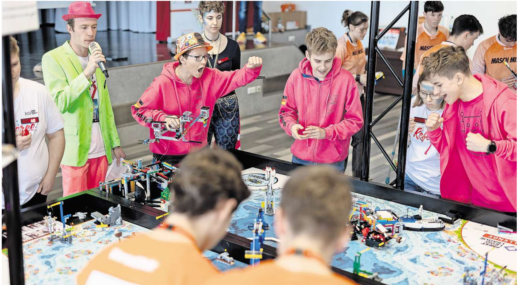
Emotionale Präsentationen: Bei den Wettbewerben der First Lego League müssen die Schüler ihre Konstruktionen vorstellen.

Eine Gruppe von naturwissenschaftlich begeisterten Jugendlichen aus der Marie-Curie-Schule kämpft mit ihren Robotern inzwischen in der First Lego League um internationale Erfolge