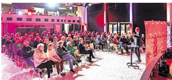
Großes Interesse: 130 Personen sind bei der Diskussionsveranstaltung mit SPD-Fraktionschef Matthias Miersch in der Marie-Curie-Schule dabei.

Zudem wurde über Themen wie Bildung, Heizungsgesetz, E-Mobilität und Ladeinfrastruktur, bezahlbares Wohnen sowie Maßnahmen zur Beschleunigung des Wohnungsbaus intensiv debattiert. Auch Schülerinnen und Schüler der Marie-Curie-Schule sowie junge Menschen aus der Region brachten ihre Perspektiven aktiv ein. Ihre Wortbeiträge zeigten laut Miersch deutlich, dass junge Menschen sich nicht nur für ihre eigenen Interessen, sondern für den gesellschaftlichen Zusammenhalt stark machen.