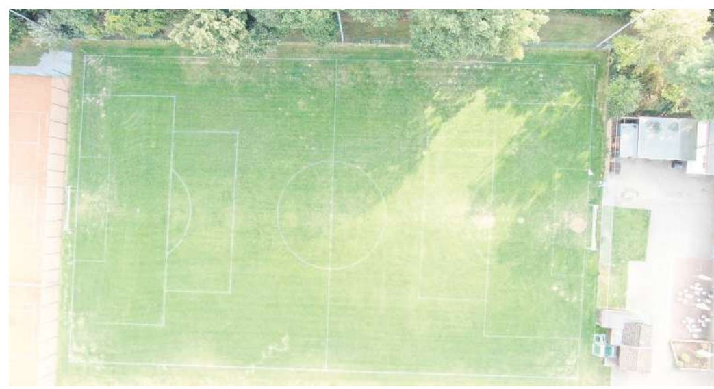
Soll bald ganzjährig bespielbar sein: Der B-Platz der Sportanlage an der Ihmer Landstraße.

Die geschätzte Nutzungsdauer betrage 15 bis 20 Jahre. In dieser Zeit sei der Wasserverbrauch deutlich geringer und es fielen kaum Pflegearbeiten an. Lediglich einmal im Monat müsse der Platz abgeburstet werden, um Moosbefall zu verhindern, erläutert der Bauhofleiter. Dünger wird nicht mehr benötigt und auch ein weiteres großes Problem der Ronneberger Anlage würde sich erledigen: „Den Maul-