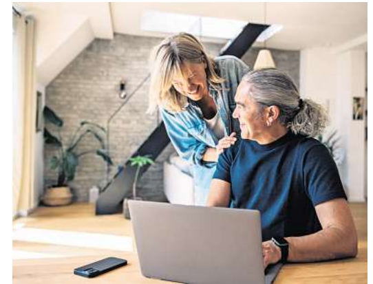
Haben gut lachen: Wessen Immobilie im Laufe der Zeit stark im Wert gestiegen ist, der kann bei der Anschlussfinanzierung von günstigeren Konditionen profitieren.

* Das vollwertige Verkehrsgutachten: Dieses Gutachten werde meist von öffentlich