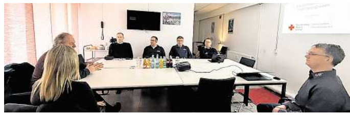
Beim Blaulichtstammtisch sprechen Vertreter von Hilfs- und Einsatzorganisationen in Barsinghausen miteinander.