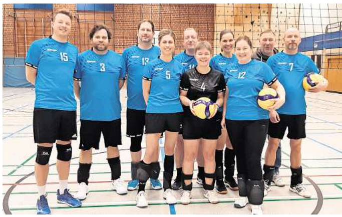
Erfolgreich und an neuen Mitspielenden interessiert: die Volleyballer der Deister Volleys.