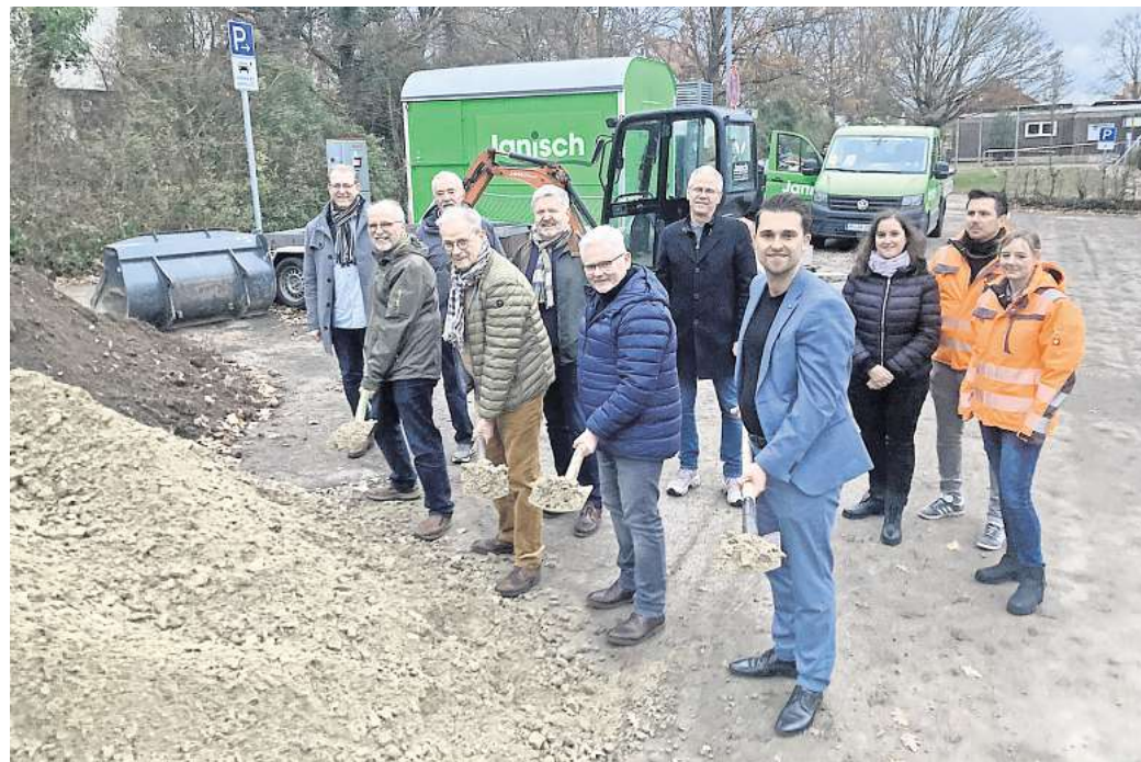
Spatenstich: Mitglieder aus Rat, Verwaltung und Kommunalpolitik freuen sich über den symbolischen Beginn.

Nun hatte die Stadt sich mit Vertretern aus Verwaltung und Kommunalpolitik doch zu einem Spatenstich getroffen – ein symbolischer Akt, weil es nun um das ganz große Gedeck geht. Denn ab Januar 2026 startet der zweite Abschnitt. Er beinhaltet eine neue Zuwegung zum Eingang des Gemeinschaftshauses. Dazu wird unter anderem eine Rampe vom Eingang entlang des Gebäudes in Richtung Parkplatz errichtet, damit das Gebäude künftig auf diese Weise