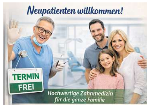
Hochwertige Zahnmedizin für die ganze Familie

WIR HABEN NOCH PLATZ FÜR NEUPATIENTEN. Das ist heute ungefähr so selten wie ein Parkplatz vor der Praxis - den wir übrigens auch haben. Wer also hoch-