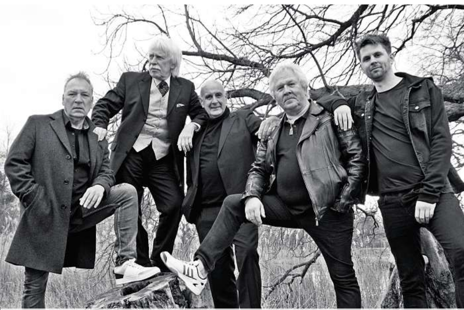
Das Konzert findet am Samstag, 24. Januar 2026 im ASB-Bahnhof, Berliner Str. 8, 30890 Barsinghausen statt. Einlass 19:15 | Beginn: 20:15 Uhr

Das Repertoire der Band besteht neben eigenen Songs unter anderem aus Cover-Songs von AC/DC, Steppenwolf und Deep Purple. Bei dieser explosiven Mischung aus Power-Rock und Rock-Ballads ist Party-Stimmung bei allen Gigs von „New Fancy“ vorprogrammiert. Ein musikalisches Highlight, welches man nicht verpassen sollte.