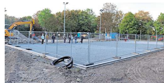
Wird vom TuS Empelde schon genutzt: Der neue Multifunktionsplatz für die Sportarten Pétanque und Bogenschießen ist bereits in Betrieb.