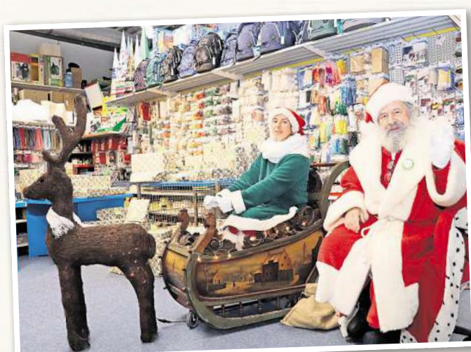
Der Weihnachtsmann will auch in diesem Jahr wieder vielen Kindern Freude bereiten...