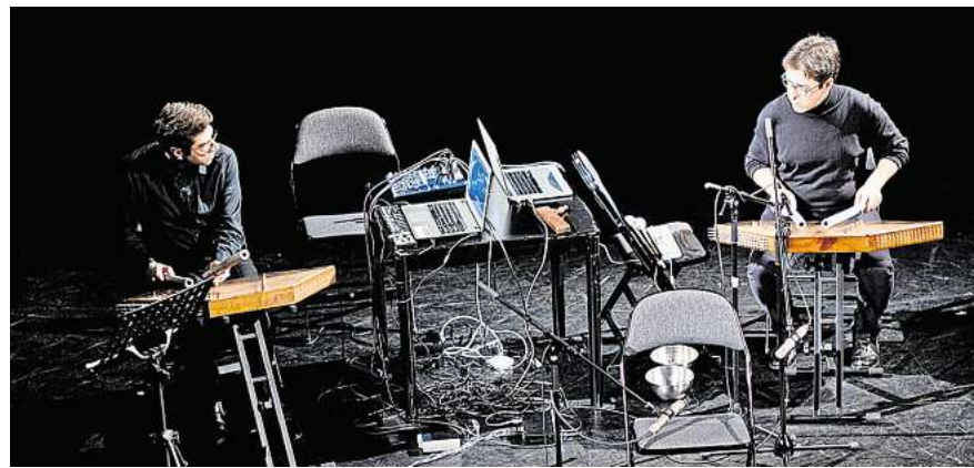
Das Duo Santronic spielt am 21. November in der FAUST Warenannahme.

Der magaScene -Tipp: Das Musik 21 Festival