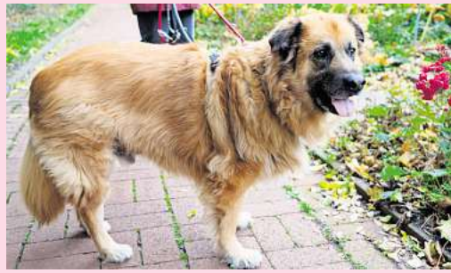
Paar Kilos zu viel: Der Tierschutzverein Barsinghausen sucht für Aufnahmehund Odin ein neues Zuhause.

Haben Sie Interesse an Odin? Dann setzen Sie sich mit uns in Verbindung unter: Tierschutzverein Barsinghausen und Umgebung, Ludwig-Jahn-Straße 11a, 30890 Barsinghausen. Telefon (05105) 7736777. Mail: info@tierschutzverein-barsinghausen.de.