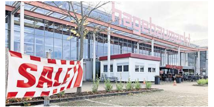
Nicht zum Verkauf: Auch wenn das Banner mit dem Aufschrift „Sale“ es vermuten lässt – hier geht es normal weiter, auch wenn sich der Name von Hagebaumarkt zu Obi ändert.

„Man muss jeden einzelnen Artikel anfassen. Denn jeder einzelne Regalmeter ist durchgeplant, jeder Haken ist definiert“, sagt Krüger. Das ist natürlich mit vielen Umräumaktionen versehen. „Auch die ganze IT wird erneuert, da passen wir uns Obi an. Zudem wird das Kassensystem umgestellt.“ Und natürlich wird es einen neuen Schriftzug am Haupteingang geben, zudem