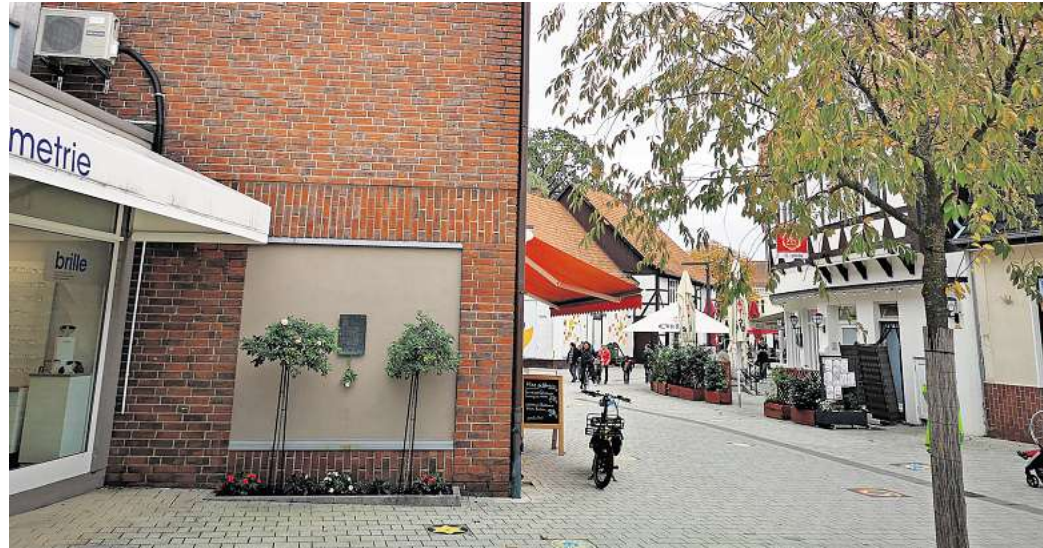
Gedenkstätte: Bis 1920 ist das heutige Wohn- und Geschäftshaus am Steinweg als Synagoge genutzt worden.

In Gehrden steht keine jüdische Einrichtung mehr. Bis 1920