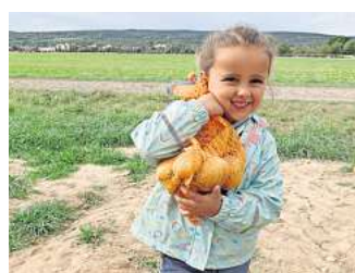
Erfolgreiche Ernte: Kinder der Kita Wirbelwind sind auf einem Kirchdorfer Feld im Einsatz

Jedes Kind durfte einen Sack befüllen. Nach dem Ernten durften die Kinder noch die große Erntemaschine aus der Nähe betrachten. Mit einem Bollerwagen voller Kartoffeln und Schmutz an den Händen ging es schließlich zurück in die Kita. Die Kartoffeln