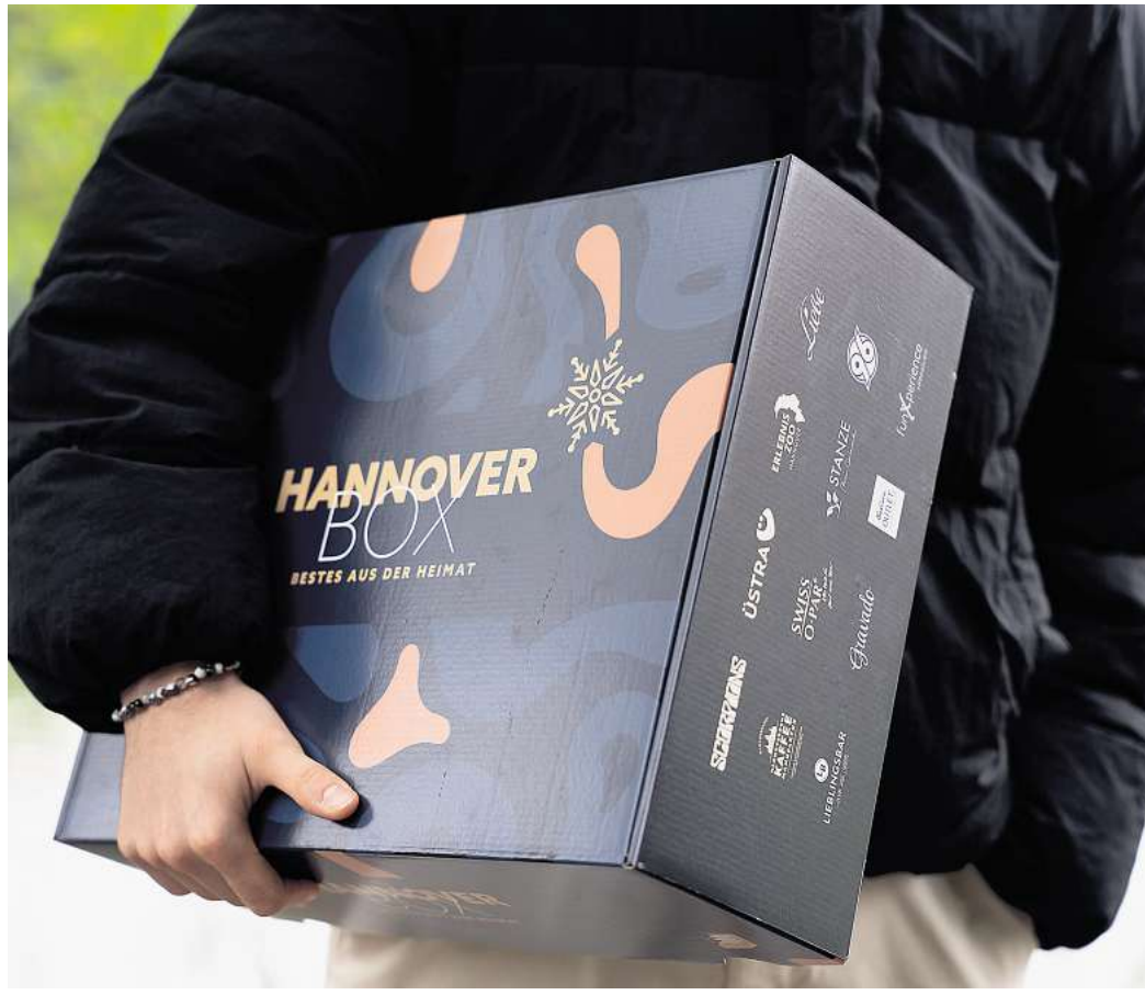
Hannovers Vielfalt im Paket: Die Hannover-Box.