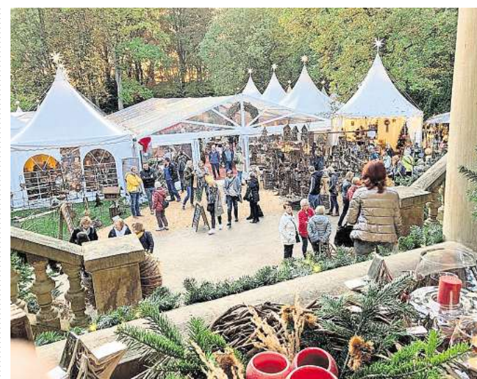
Die WinterTräume in Eldingen sind ein Fest für alle Sinne.

Viele weitere, spannende Neuigkeiten aus der lokalen Kulturszene finden Sie in der aktuellen Ausgabe unseres Partnermediums magaScene, monatlich frisch gedruckt und kostenlos an über 500 Auslegestellen in Hannover oder online auf www.magaScene.de inklusive Download-Möglichkeit.