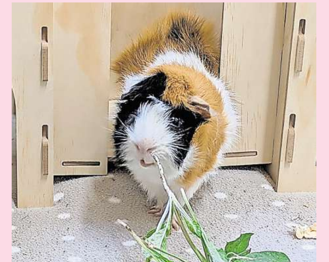
Aufgefäpelt: Das Meerschweinchen Eduard kommt aus einem verwahrlosten Haushalt und soll nun in neue Hände übergeben werden.

Interessierte wenden sich an den Tierschutzverein unter der Hotline (05105) 7736777.