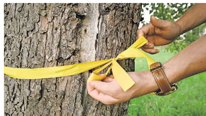
Hier darf gepflückt werden: In Lehre können sich Obstbaumbesitzer an der Aktion „Gelbes Band“ beteiligen.

Doch es gilt auch einige Regeln zu befolgen. Es soll ausschließlich von den Bäumen der genannten Bereiche geerntet werden. Das Eigentum anderer soll stets respektiert und mit der Natur achtsam umgegangen werden. Gepflückt werden soll ohne Leitern und Ähnliches. Stattdessen bittet die Stadt darum, nur in Reichweite zu ernten oder vom Boden aufzulesen.