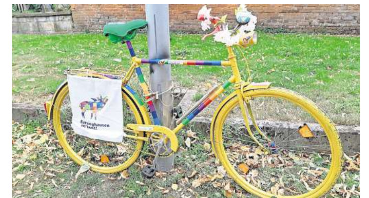
Neues Denkmal: Die Mitglieder des Vereins Barsinghausen ist bunt haben ein neues Fahrrad anstelle des Gestohlenen aufgestellt. Inzwischen ist das alte wieder aufgetaucht.