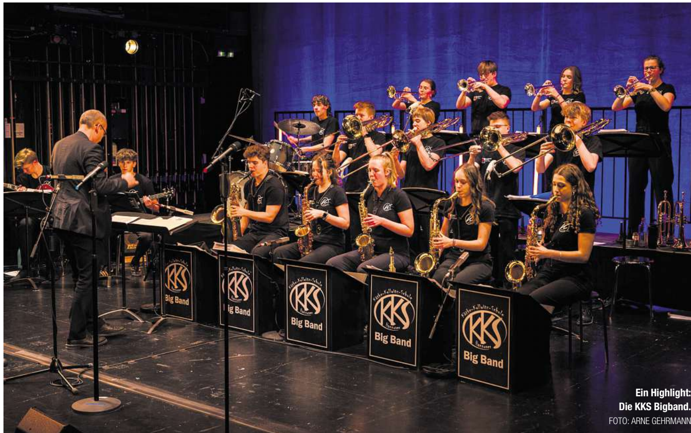
Ein Highlight: Die KKS Big Band.

Es präsentieren sich an etwa 150 Ständen diverse Aussteller. Das Angebot reicht hier vom Kunsthandwerker bis zum örtlichen Gewerbetreibenden, jeder Stand wird eine kleine Mitmach-Aktion anbieten. Es gibt spannende Fahr- und Aktionsgeschäfte und natürlich ist auch für das leibliche Wohl gesorgt. Unter anderem sind hierfür mehrere Foodtrucks vorgesehen. Ein Highlight des Bothfelder Herbstmarktes ist immer die traditionelle Tombola mit Preisen im Gesamtwert von rund 30.000 Euro. Jedes fünfte Los ist hier ein Gewinn. Wenn der Stadtteil feiert, darf Live-Musik natürlich nicht fehlen, und die gibt es auf den vier Bühnen an beiden Tagen