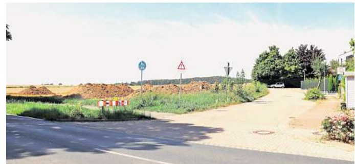
Die Lage des Baugrundstückes: Der neue Feuerwehrstandort soll zwischen der Deisterstraße und der Straße Im Steerfeld am Ortsausgang in Richtung Degersen eingerichtet werden.

Das Millionenprojekt in Lemmie beginnt mit archäologischen Untersuchungen