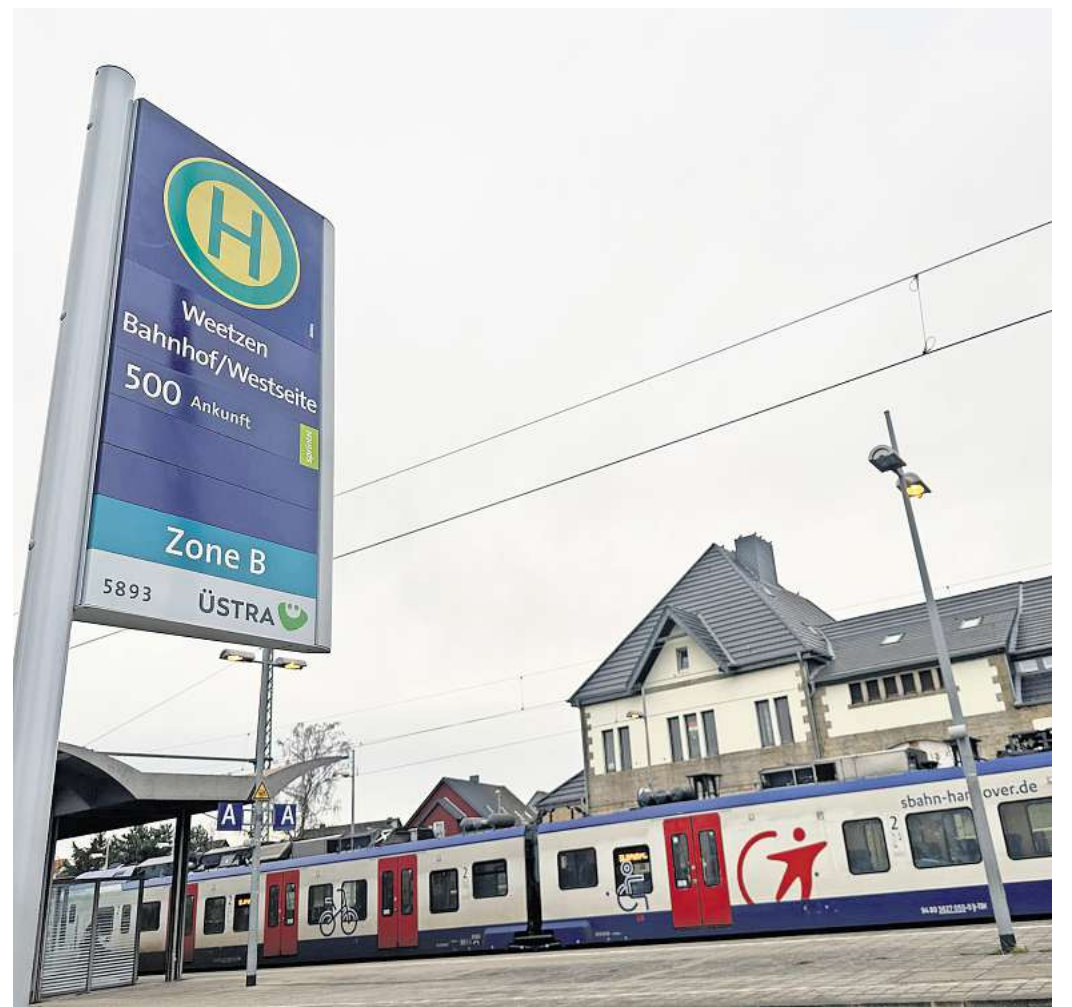
Anbindung an die S-Bahn: Mit der Umstellung der Fahrpläne fahren die Busse der Linie 500 ab Mitte Dezember auch bis zum S-Bahnhof nach Weetzen.

Im Gegensatz zu anderen Kommunen an der S-Bahn-Strecke besteht für die Fahrgäste aus Gehrden auch eine Alternative für den Weg nach Hannover, falls wieder einmal Probleme bei der Bahn auftreten. Sie gelangen weiterhin mit der SprintH-Linie 500 nach Wettbergen oder mit der Linie 560 nach Ronnenberg und können in Empelde in die Stadtbahn umsteigen – oder mit der SprintH-Linie 500 direkt bis zum ZOB in Hannover fahren. „Einfach toll, dass der 500'er jetzt bis nach Weetzen durchgeht“, sagt denn auch Conny Gietz. Zudem sei die enge Taktung des Sprinters eine deutliche Verbesserung im Vergleich zu früheren Jahren. „Aus meiner Sicht hat sich die Situation deutlich verbessert“, sagt sie und weiß nach eigenen Angaben, wovon sie spricht: Denn Gietz besitzt kein Auto. Weil sie zwischen mehr zwischen Empelde und Gehrden pendelt, hat sie dennoch einen Wunsch: einen dichteren Takt zwischen den beiden Ortschaften. „Vielleicht würden dann noch mehr Menschen umsteigen“, sagt sie.