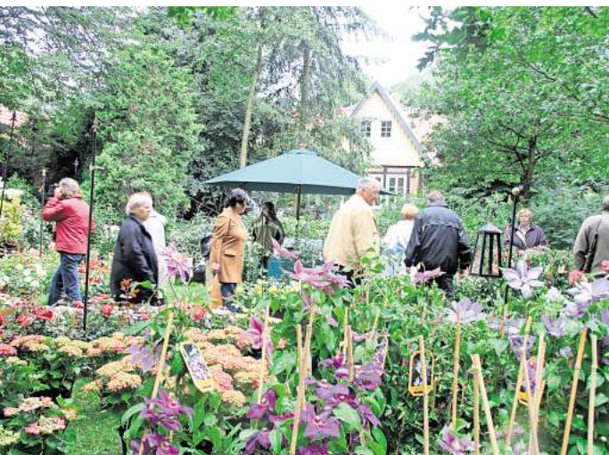
Das Gartenfestival lädt zum Stöbern in historischer Kulisse ein.