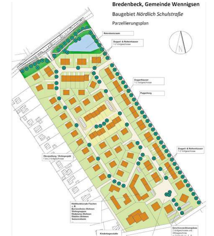
Plan des Baugebiets mit Parzellierung der Grundstücke: Nach aktuellem städtebaulichen Entwurf sind 123 Wohneinheiten geplant. Die Bebauung ist aber nur beispielhaft und kann noch verändert werden.

Das Neubaugebiet „Im Bergfelde“ erstreckt sich zwischen der Grundschule Bredenbeck (Schulstraße) und der Landesstraße 389. Mit gut 120 Einheiten auf 6,7 Hektar Fläche ist es das derzeit größte Wennigser Wohnneubauprojekt. Die Grundstücke für Einfamilien- und Doppelhäuser verkauft die NLG an Privatpersonen, der Preis liegt bei einheitlich 287 Euro pro Quadrat-