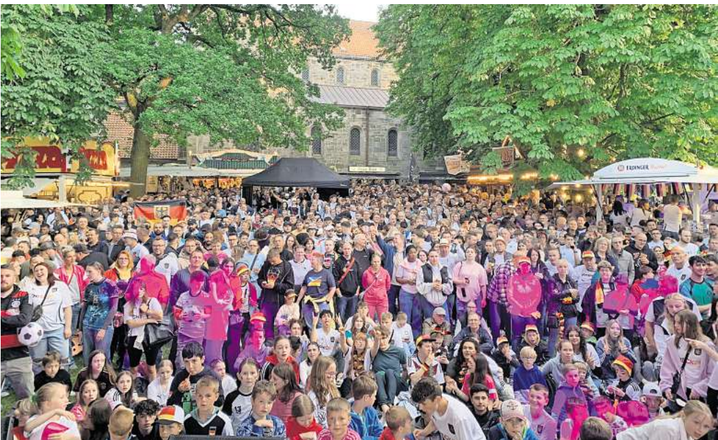
Voller Kirchplatz: Vor der Parkbühne haben beim Stadtfest im vergangenen Jahr besonders viele Menschen gefeiert.