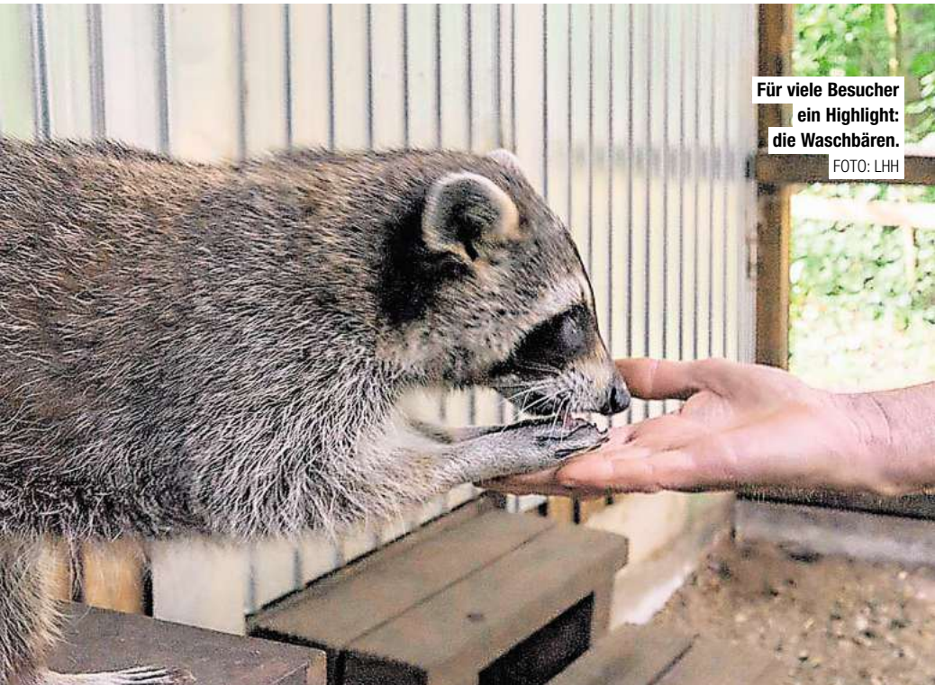
Für viele Besucher ein Highlight: die Waschbären.

selbstständig erkunden, oder Euch zu ausgewählten Themen gegen eine geringe Gebühr führen lassen. Bei selbstständigem Erkunden der Stationen könnt Ihr Euch mit einem Audioguide, dem neuen Hörführer, von Elli Eichhorn durch die Erlebnis-Stationen führen lassen. Diesen könnt Ihr im Hauptgebäude der Waldstation gegen Hinterlegen eines Pfands ausleihen. Zusätzlich könnt Ihr dort Experimentierkoffer, Becherlupendosen, Stethoskope, Ferngläser und unterschiedliche