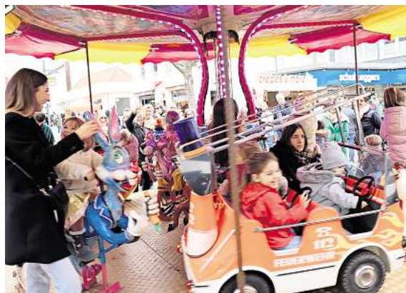
Entspanntes Shoppen für die Eltern, Spiel und Spaß für die Kids. So funktioniert der erste verkaufsoffene Sonntag.

Flanieren und schnabulieren auf dem Ostermarkt mit leckeren Gastroangeboten und mehr