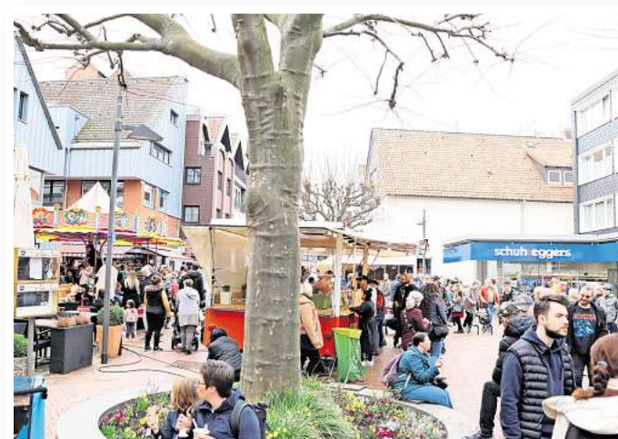
Shoppen und genießen: Der Verein „Unser Barsinghausen“ lädt zum Ostermarkt mit verkaufsoffenem Sonntag und Schlemmermeile ein.

Bevor am 7. April die Osterferien in Niedersachsen beginnen und wir am 20. April das Osterfest feiern, laden am Sonntag, 30. März, die teilnehmenden Geschäfte in Barsinghausen von 13 bis 18 Uhr zum ersten verkaufsoffenen Sonntag des Jahres ein. Dank der Koordination durch den