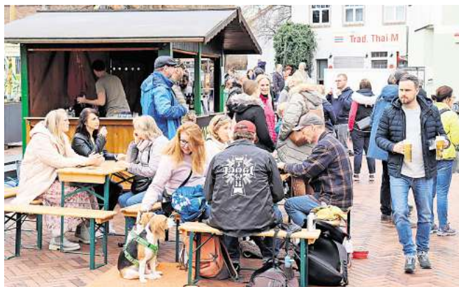
Die Mitglieder des Round Table verkaufen Hotdogs. Passend dazu kreuzt die 405er Brauerei ihr Bier in mehreren Variationen.