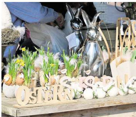
Frühlingshaftes gibt es beim verkaufsoffenen Sonntag auf dem Frühlingsmarkt zu entdecken.