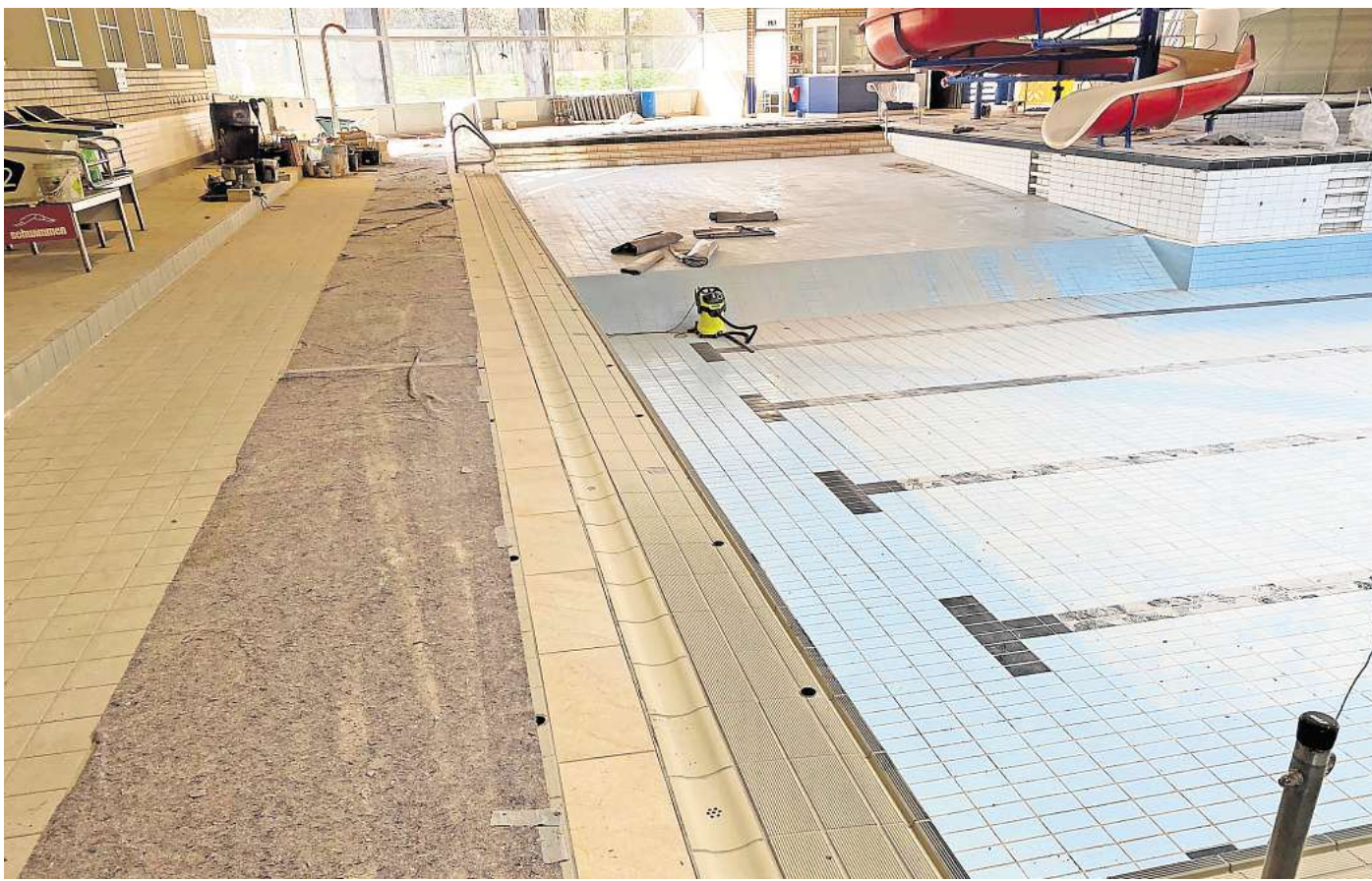
Neuer Anblick: Das Gerüst ist verschwunden und der Beckenkopf fertig gefliest.

Mit an Board ist dann auch ein neuer Pächter der Gastronomie. Den Namen wollen Badleiter und Geschäftsführer noch nicht nennen. Nur so viel: Er komme zwar nicht aus der Gastronomie, sei