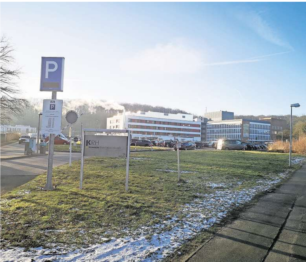
Modernisierung geplant: Das Klinikum in Gehrden erhält einen Teilneubau. Fast 250 Millionen Euro wird das kosten.