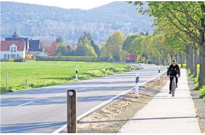
Radweg zwischen Holtensen und Bredenbeck: Auf der als Schulweg genutzten Strecke wünscht sich Ortsbürgermeister Wilhelm Subke eine Beleuchtung.

Hinzu kommen Wunschprojekte, die erst auf den Weg gebracht werden müssen: Dazu zählt die Beleuchtung des Radweges nach Bredenbeck – „ein Schulweg“, betont Subke. Außerdem: Die Installation einer Dunkelampel im Bereich der Schulbushaltestelle an der Lin-