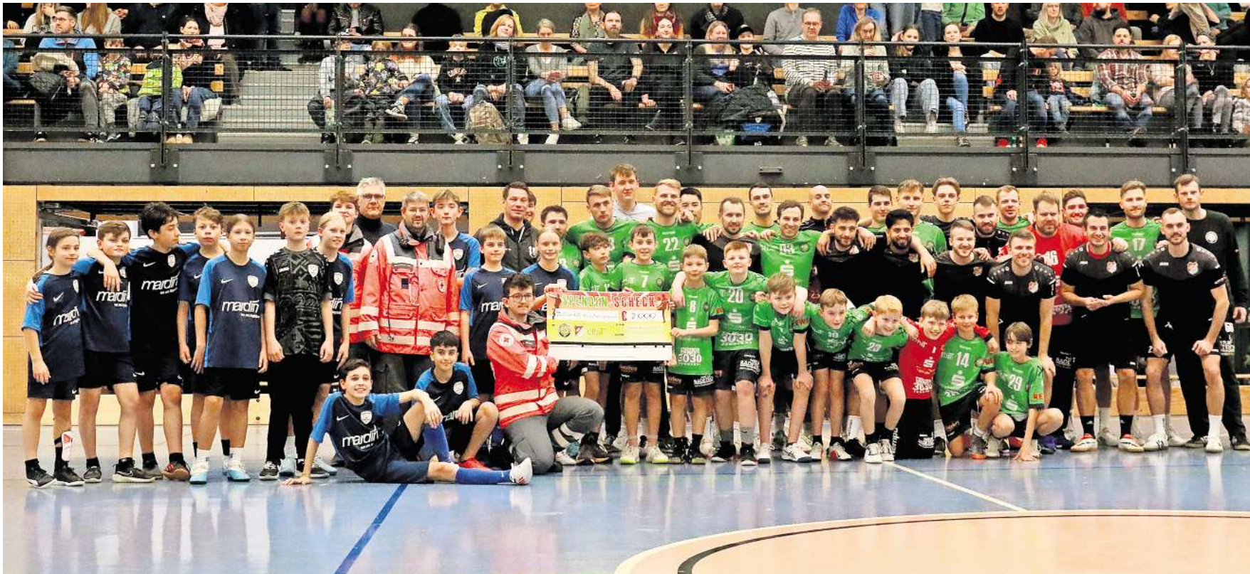
Großer Rahmen mit allen Teilnehmern: Die Mannschaften mit dem symbolischen DRK-Scheck.

Die Handballer suchen den Vergleich mit den Kickern – und in der Glück-Auf-Halle wird auch der Vorstand geehrt