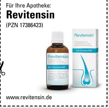
Abbildung Betroffenen nachempfunden REVITENSIN. Wirkstoffe: Acidum hydrofluoricum Dil. D12, Graphites Dil. D8, Pel. talpae Dil. D8, Selenium Dil. D12, Thallium metallicum Dil. D12. Homöopathisches Arzneimittel zur unterstützenden Behandlung bei Haarausfall. www.revitensin.de • Zu Risiken und Nebenwirkungen lesen Sie die Packungsbeilage und fragen Sie Ihre Ärztin, Ihren Arzt oder in Ihrer Apotheke. • PharmaSGP GmbH, 82166 Gräfelfing

Egal in welchem Alter oder Lebensphase: Wir Frauen stylen uns gerne, um unsere Haare in Form zu bringen. Aber wenn wir merken, dass die Haare zunehmend ausfallen , ist das erschreckend! Dabei ist uns schönes Haar doch so wichtig! Immer mehr Anwenderinnen vertrauen inzwischen auf das rezeptfreie Revitensin (Apotheke), das verschiedene Formen von Haarausfall von innen bekämpfen kann. Bei Revitensin ist keine äußere Anwendung erforderlich, sodass die Frisur nicht darunter leidet. Die natürlichen Arzneitropfen werden einfach mit einem Glas Wasser eingenommen. Neben- oder Wechselwirkungen sind nicht bekannt. Aufgrund der Wachstumsphase der Haare empfiehlt der Hersteller eine Einnahme von mindestens 12 Wochen.