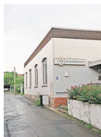
Wegen finanzieller Engpässe wird die Heizung im Dorfgemeinschaftshaus doch erst im nächsten Jahr erneuert.

städtischer Benutzungssatzung private Personen aus allen sieben Ronneberger Stadtteilen die DGHs in Linderte und Vörie für ihre Feierzwecke nutzen. „Es ist nicht möglich, das auf die Ortschaft zu begrenzen“, sagt Frank Schulz, als Fachbereichsleiter im Rathaus für die städtische Gebäudewirtschaft zuständig. Das habe der Ortsrat gerne in der Hoffnung versucht, Mieter aus Linderte zu mehr Nutzungsdisziplin anhalten zu können. Nun muss das Gremium aber wohl oder übel das komplette Verbot der privaten Nutzung einleiten.