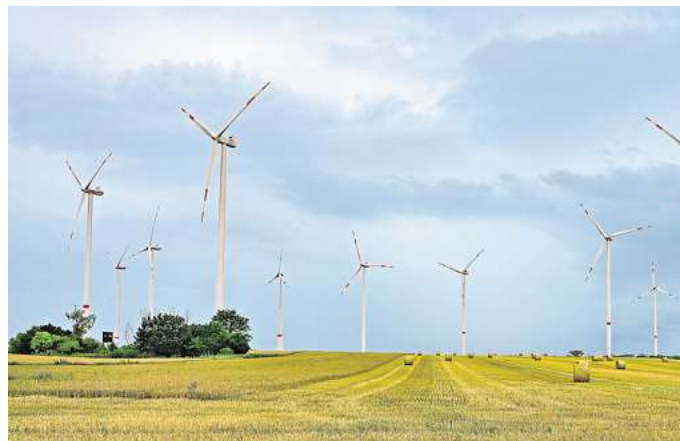
Weiterer Ausbau: In Deutschland soll es viel mehr Windenergieanlagen geben. Bis zu 15 davon könnten in Ronneberg gebaut werden.

Bei den Planungen der Region und der Stadt stehen Beteiligungen an. Auch der Verein Mensch + Wind und Investor UKA Nord informieren.