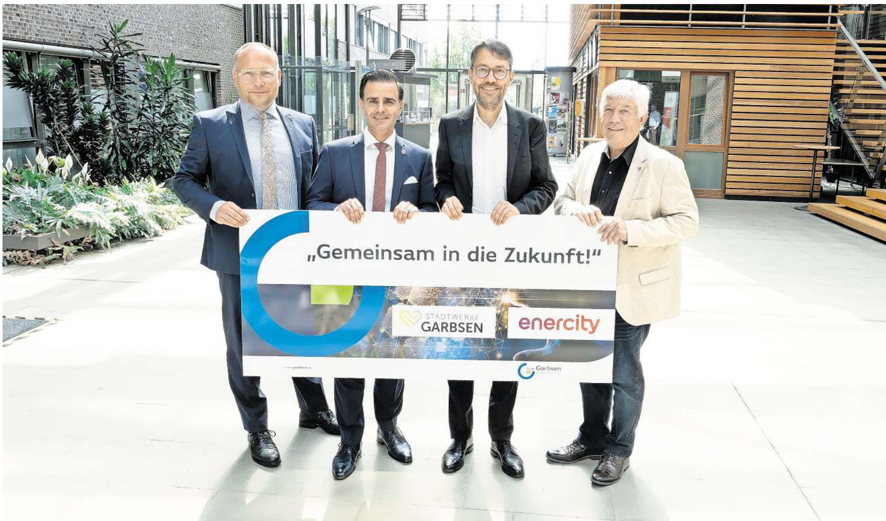
Der hannoversche Energieversorger Enercity übernimmt das Strom- und Gasnetz der Stadtwerke Garbsen und zahlt dafür einen mittleren zweistelligen Millionenbetrag.

Die hohen Investitionssummen in die vielerorts veraltete Infrastruktur muss dann der Konzern stemmen. Er wolle den Aufwand nicht verniedlichen, betonte Finanzvorstand Hansmann, aber das gehöre zum Standardgeschäft und man sei dafür gut gerüstet. Den Verkaufspreis bezeichneten die Parteien als „fair und marktüblich“.