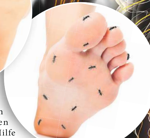
Kribbelnden Füße infolge von Nervenschmerzen?

der einzelne darin enthaltene Wirkstoff kann bei nervenbedingten Schmerzen wertvolle Hilfe leisten. So setzt beispielsweise Gelsemium sempervirens laut Arzneimittelbild im zentralen Nervensystem an, also unter anderem im Rückenmark. Der Arzneistoff Iris versicolor kommt hingegen bei ausstrahlenden Schmerzen wie einer Ischialgie und ziehenden, brennenden Schmerzen im Hüft nerv zum Einsatz.