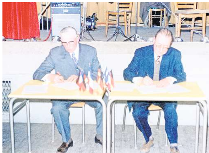
Vertrauen auf die Eigenständigkeit: Nur ein Jahr vor der Eingemeindung Ihme-Rolovens, unterzeichnen die Bürgermeister aus Raneshaus (Frankreich) und Ihme-Roloven 1973 die Partnerschaftsurkunde zwischen den beiden Gemeinden.

Vor dem Erzählcafé wenig beachtet war allerdings der Aspekt,