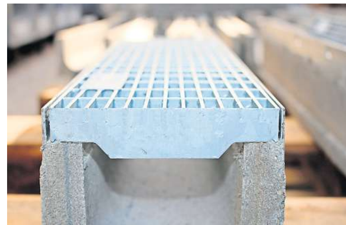
Schlank, leicht und komfortabel in Transport und Montage: Die Entwässerungslösung leitet Regenwasser zuverlässig ab und ist hochbelastbar (bis Belastungsklasse C 250).

die Herstellung von „made in Germany“-Entwässerungslösungen spezialisiert, die pure Effizienz, eine hohe Stabilität und ein ansprechendes Design gekonnt kombinieren. Neu im Sortiment ist ein absolutes Leichtgewicht, das in puncto Leistung, Langlebigkeit und Komfort schwere Geschütze auffährt. Die neuen Entwässerungsrinnen zeichnen sich durch ein minimales Gewicht bei gleichzeitig maximaler Stabilität aus: Obwohl sie aus hochwertigem Beton gefertigt werden, weisen sie lediglich ein Gewicht ab 12,9 kg pro laufendem Meter auf und sind da-