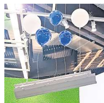
Mit einem Gewicht ab 12,9 kg pro laufendem Meter ist die Entwässerungsrinne ein echtes Leichtgewicht.