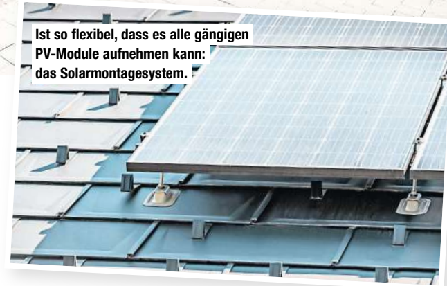
Ist so flexibel, dass es alle gängigen PV-Module aufnehmen kann: das Solarmontagesystem.

Paneele und Rauten aus Aluminium sind bspw. so robust, dass ihnen selbst Orkane, Dauerregen oder Hagelkörner nichts anhaben können. Durch die indirekt verdeckte Befestigung und das Ineinandergreifen der einzelnen Elemente kann nichts wegfliegen, alles bleibt an seinem Platz. Und: Da Aluminium eine dicke Oxidschicht hat, setzt kein Korrosionsprozess ein. Das Dach bleibt dauerhaft rostfrei und optisch ansprechend wie am ersten Tag. Kein Wunder also, dass der