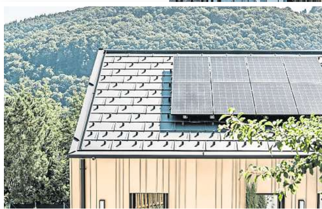
Das Solarmontagesystem fixiert PV-Module auf jedem Aluminiumdach.

Paneele und Rauten aus Aluminium sind bspw. so robust, dass ihnen selbst Orkane, Dauerregen oder Hagelkörner nichts anhaben können. Durch die indirekt verdeckte Befestigung und das Ineinandergreifen der einzelnen Elemente kann nichts wegfliegen, alles bleibt an seinem Platz. Und: Da Aluminium eine dicke Oxidschicht hat, setzt kein Korrosionsprozess ein. Das Dach bleibt dauerhaft rostfrei und optisch ansprechend wie am ersten Tag. Kein Wunder also, dass der