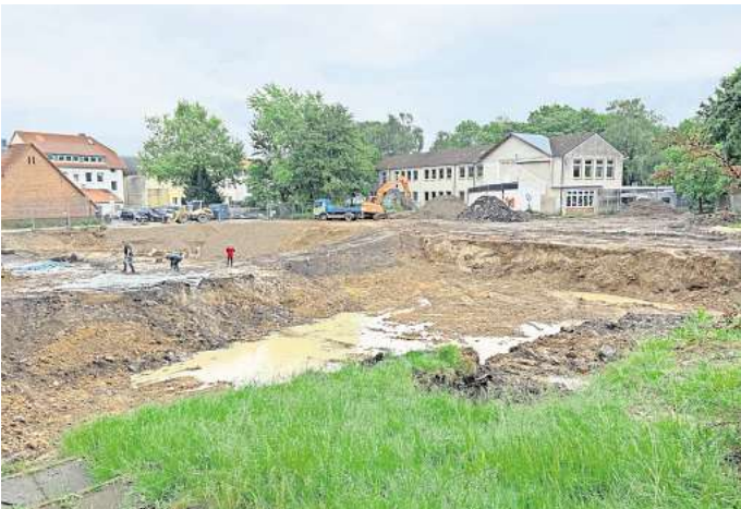
Abriss: Bis auf den alten Ostflügel auf dem hinteren Teil des Grundstücks steht von der alten Wilhelm-Stedler-Schule inzwischen nichts mehr. Dieser Trakt bleibt vorerst stehen, weil darin ein Teil der Schülerinnen und Schüler weiterhin unterrichtet wird.

Um deutliche Einsparungen zu erzielen, schlug die FDP vor, die Gewerke einzeln auszu-schreiben. Ihr Änderungsantrag wurde in der Ratsitzung mit rot-grüner Mehrheit abgelehnt. Eggert rechnet vor: „Durch eine überarbeitete Planung und Einzelausschreibung der verschiedenen Baugewerke hätten wir bis zu 10 Prozent der Kosten einsparen können, was momentan etwa 2 Millionen Euro ent-spricht.“