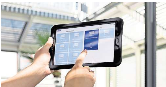
Sind auch die Rollläden in die Haussteuerung integriert, lassen sie sich ganz einfach per App über das Tablet bedienen.

mierbaren und per Fernbedienung oder mobilem Endgerät bedienbaren Systemen aufrüsten, die ein Plus an Komfort und Sicherheit bieten. Praktisch: Die Rollläden sind Alexa-kompatibel und gehorchen aufs Wort. Sorgt bspw. intensives Sonnenlicht für lästige Reflexionen auf TV-Bildschirm, Laptop & Co., genügt ein Sprachbefehl an den cloudba-