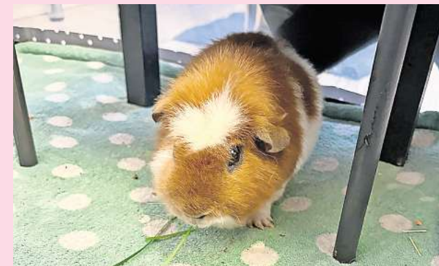
Lucky sucht ein neues Zuhause.

Tierschutzverein Barsinghausen und Umge. Ludwig-Jahn-Straße 11a 30890 Barsinghausen Telefon (05105) 7736777