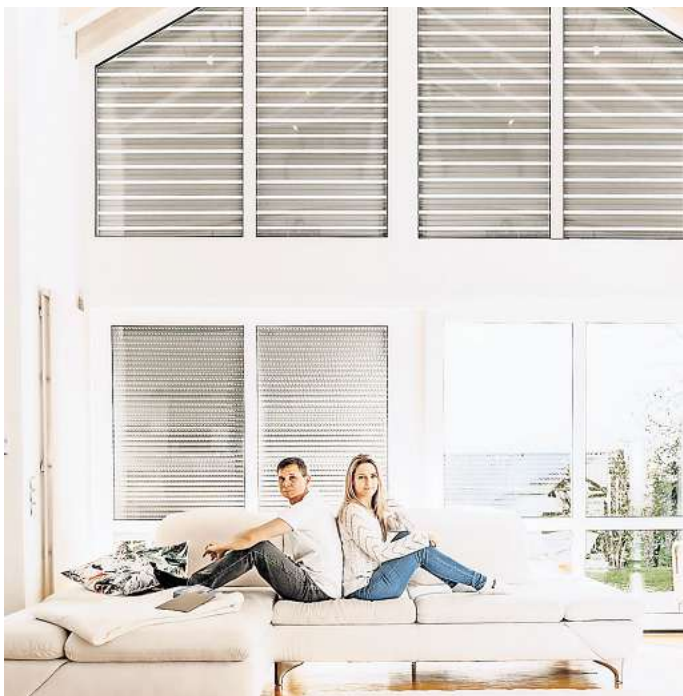
Einfach clever: Smart Home-Rollläden machen das Wohnen noch komfortabler, effizienter und sicherer.

Ob Haushaltsgeräte oder Unterhaltungselektronik: Fast alles lässt sich in Smart Home-Systeme einbinden und bedarfsgerecht steuern – von zu Hause oder unterwegs. Das macht das Wohnen besonders komfortabel, effizient und sicher. Auch Rollläden werden gerne in die Haussteuerung integriert. Sind sie mit Sensoren ausgestattet, die die Lichtintensität messen, fahren sie morgens automatisch hoch und abends wieder herunter. Natürlich lassen sie sich auch manuell oder – zum Beispiel bei Abwesenheit – per Smartphone oder Tablet bedienen – ganz nach persönlichem Wunsch. Weil Smart Home-Rollläden so viele Möglichkeiten eröffnen, lohnt sich auch die Nachrüstung: Sie eignet sich für bereits motorisierte Rollläden und sollte immer vom Fachmann durchgeführt werden. Auch elektrische Aluminium-Rollläden lassen sich problemlos zu program-