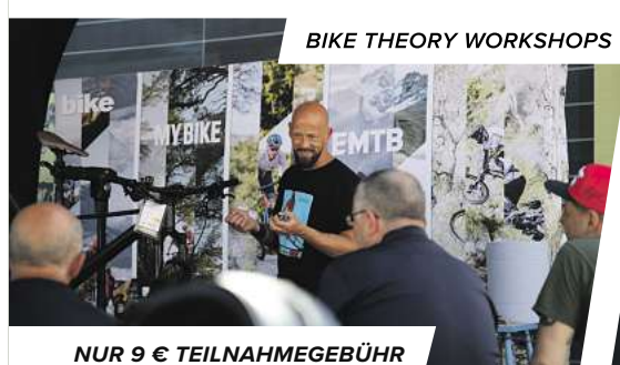
BIKE THEORY WORKSHOPS

Von Alltag bis Trail - sportliche E-MTB Power überall