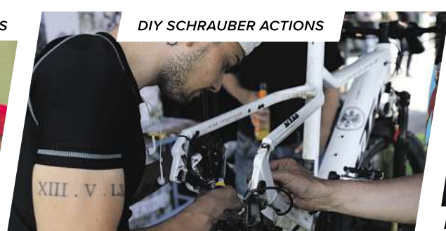
DIY SCHRAUBER ACTIONS