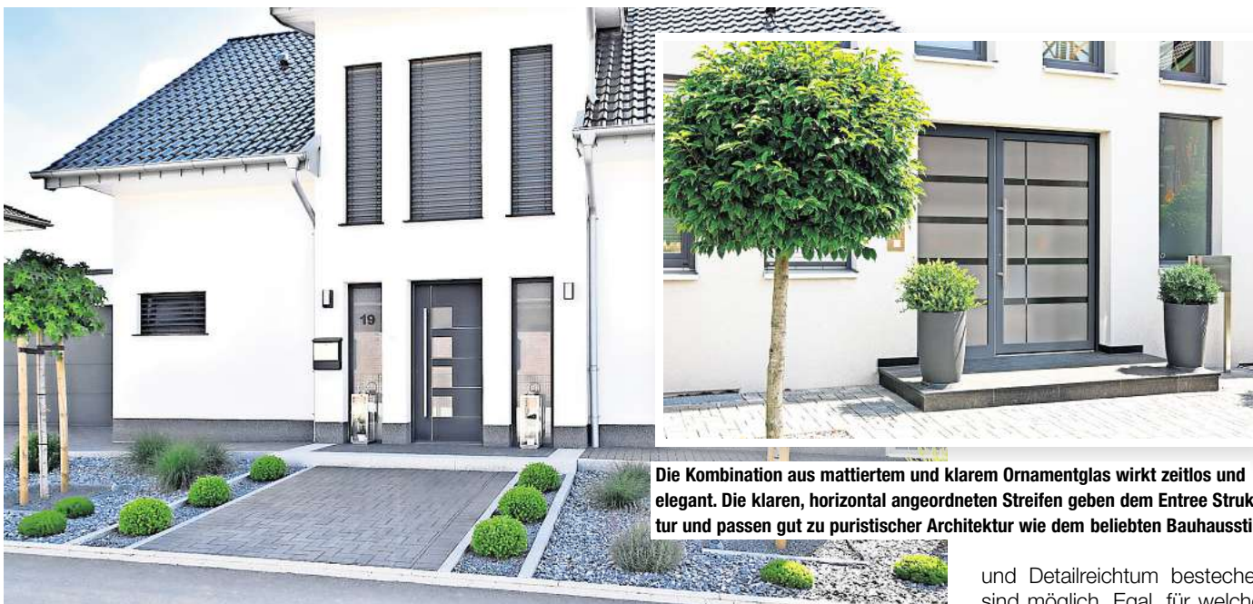
Die Kombination aus mattiertem und klarem Ornamentglas wirkt zeitlos und elegant. Die klaren, horizontal angeordneten Streifen geben dem Entree Struktur und passen gut zu puristischer Architektur wie dem beliebten Bauhausstil.

Puristisch und gleichzeitig funktional sind etwa Ganzglas-Seitenteile aus mattiertem Glas mit klarem Rand, bei denen Hausnummer oder Straßenna-me als klares Motiv integriert werden. Besondere Akzente erzielen