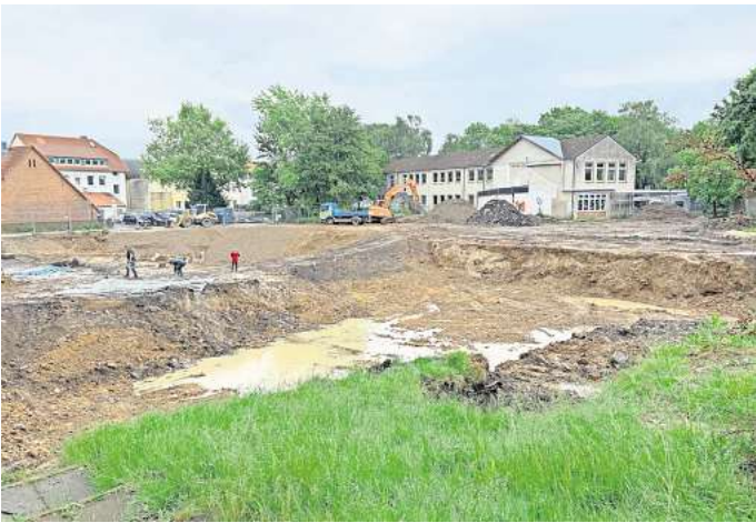
Abriss: Bis auf den alten Ostflügel auf dem hinteren Teil des Grundstücks steht von der alten Wilhelm-Stedler-Schule inzwischen nichts mehr. Dieser Trakt bleibt vorerst stehen, weil darin ein Teil der Schülerinnen und Schüler weiterhin unterrichtet wird.

Um deutliche Einsparungen zu erzielen, schlug die FDP vor, die Gewerke einzeln auszu-schreiben. Ihr Änderungsantrag wurde in der Ratsitzung mit rot-grüner Mehrheit abgelehnt. Eggert rechnet vor: „Durch eine überarbeitete Planung und Einzelausschreibung der verschiedenen Baugewerke hätten wir bis zu 10 Prozent der Kosten einsparen können, was momentan etwa 2 Millionen Euro ent-spricht.“