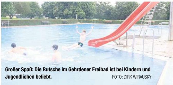
Großer Spaß: Die Rutsche im Gehrden Freibad ist bei Kindern und Jugendlichen beliebt.

Der Außenbereich am Delfi-Bad ist jetzt freigegeben