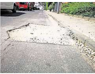
Kaputte Fahrbahn: Gut 20 Prozent der Straßen im Stadtgebiet weisen erhebliche Mängel auf.

Etwa 80 Kilometer Straßen hat die GSA erfasst und untersucht. Geprüft wurden die Oberflächen und auch die Tragfähigkeit der Fahrbahnen. 50 Prozent aller Straßen in Gehrden und in den Ortsteilen seien demnach okay, meinte Simon. Beim Rest seien Mängel festgestellt worden; bei 20 Prozent seien Eingrif-