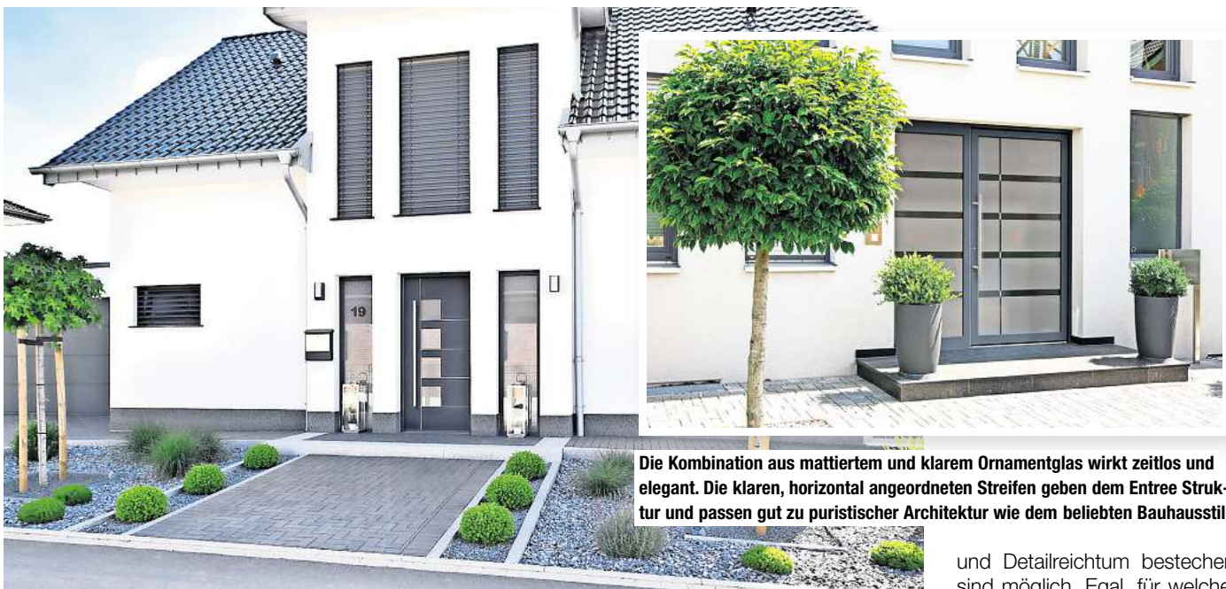
Für Haustürfüllungen gibt es verschiedene Ornamentgläser und detailreiche Schmuckverglasungen, die gläserne Eleganz in den Eingangsbereich einziehen lassen

Puristisch und gleichzeitig funktional sind etwa Ganzglas-Seitenteile aus mattiertem Glas mit klarem Rand, bei denen Hausnummer oder Straßenna-me als klares Motiv integriert werden. Besondere Akzente erzielen