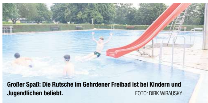
Großer Spaß: Die Rutsche im Gehrden Freibad ist bei Kindern und Jugendlichen beliebt.

Der Außenbereich am Delfi-Bad ist jetzt freigegeben