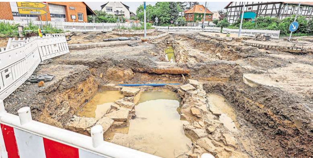
So sieht es aktuell auf der B 217-Baustelle aus: Die freigelegte Steinmauer ist in der Mitte des Bildes zu sehen, die Linderter Straße verläuft in Blickrichtung, links ist das Feuerwehrhaus.

Nach Mauerfund: Freigabe der Ortsdurchfahrt vor Sommerferien weiterhin realistisch