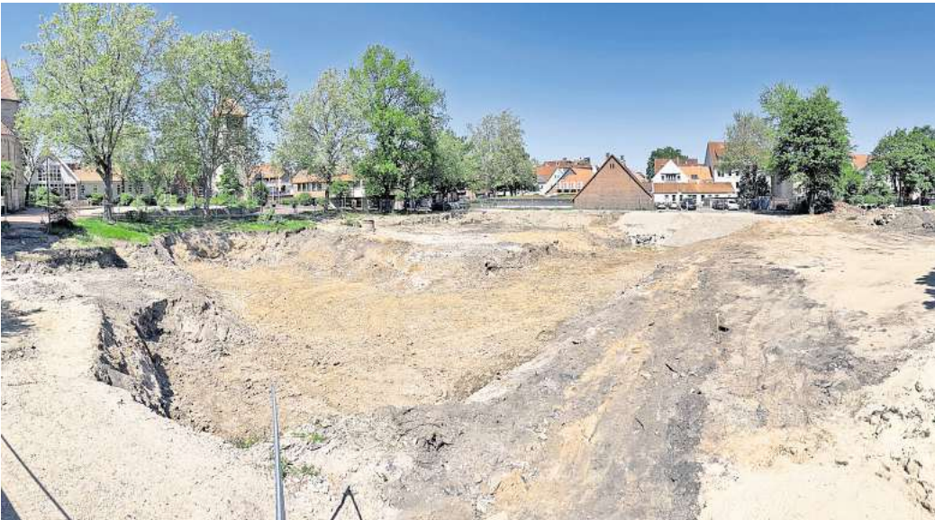
Riesige Grube: Der größte Teil der archäologischen Arbeiten ist beendet. Beim Abriss des Westflügels der Schule, entdeckten die Archäologen Spuren eines ehemaligen, künstlich angelegten Teichs.

Die aktuellen Untersuchungen haben das bisherige Wissen um ein Vielfaches erweitert. War