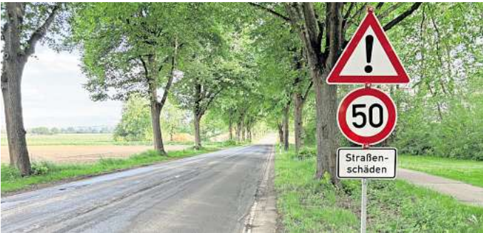
Straßenschäden auf der L390: Der Umleitungsverkehr um die gesperrte B 217 hat Spuren hinterlassen. Stellenweise gilt auf der Strecke Tempo 50.

Auf der Umleitungsstrecke zeigt sich derweil immer deutlicher, dass die Straßen der enormen Verkehrsbelastung mit täglich Tausenden Pendlerinnen und Pendlern nicht unbegrenzt