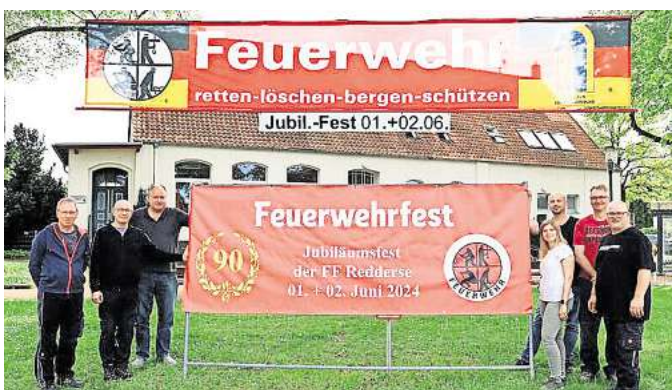
Vorfreude: Mit einem zweitägigen Fest feiert die Ortswehr Redderse ihr 90-jähriges Bestehen.

Abwechslungsreiches Programm mit Scheunenfest, Löschparty mit Showblock, Festumzug und Katerfrühstück