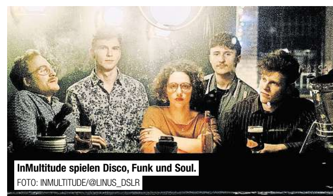
InMultitude spielen Disco, Funk und Soul.

16.30 Uhr: Sound of Hope Das Bandprojekt, entstanden aus der Geflüchteten-Initiative in Bantorf, hat bereits bei zahlreichen Auftritten in der Region für Begeisterung gesorgt. Mit einem bunten Mix aus Liedern aus den Herkunftsländern der Musiker*innen und auch internationalen Hits weiß sie das Publikum zu unterhalten.