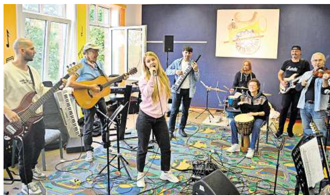
Im internationalen Bandprojekt Sound of Hope spielen geflüchtete und einheimische Musikerinnen und Musiker gemeinsam.