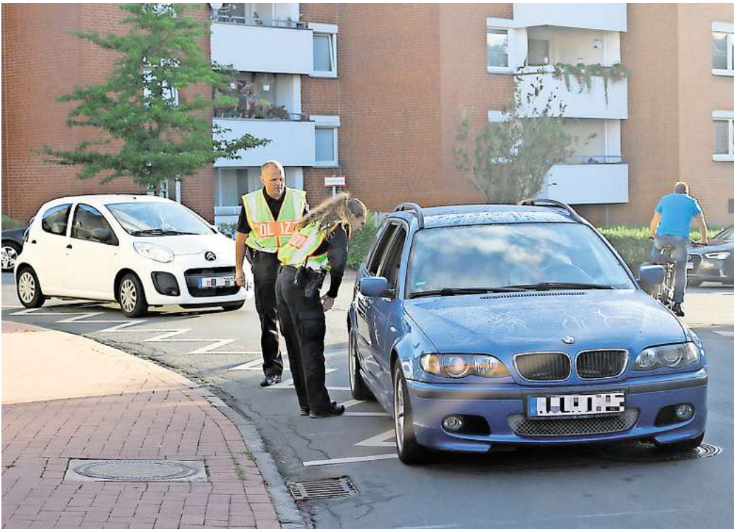
Verstärkter Einsatz: Die Polizei in Ronnenberg will vor allem in Empelde die Schulwegüberwachung – auch von Elterntaxis – intensivieren.

Kommissariat Ronnenberg intensiviert die Maßnahmen zur Überwachung der Schulwege