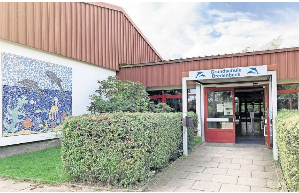
Ganztagschule bis 2026? Die Gemeinde arbeitet an einem Konzept, um den Rechtsanspruch in dem Zeitraum auch für die Grundschule Bredenbeck umzusetzen zu können.

Die Region Hannover wolle sich damit behelfen, „im Einzelfall bedarfsgerechte Lösungen zu ermöglichen“ und hoffe laut Schlossarek darauf, dass nicht so viele Eltern den Rechtsanspruch einklagen werden. „Insgesamt