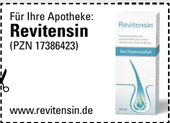
Abbildung Betroffenen nachempfunden REVITENSIN. Wirkstoffe: Acidum hydrofluoricum D12, Graphites D12, Pelletariae D12, Selenium D12, D12, Thallium metallicum D12, D12. Homöopathisches Arzneimittel zur unterstützenden Behandlung bei Haarausfall. www.revitensin.de • Zu Risiken und Nebenwirkungen lesen Sie die Packungsbeilage und fragen Sie Ihre Ärztin, Ihren Arzt oder in Ihrer Apotheke. • PharmaSGP GmbH, 82166 Gräfelfing

Egal in welchem Alter oder Lebensphase: Wir Frauen stylen uns gerne, um unsere Haare in Form zu bringen. Aber wenn wir merken, dass die Haare zunehmend ausfallen , ist das erschreckend! Dabei ist uns schönes Haar doch so wichtig! Immer mehr Anwenderinnen vertrauen inzwischen auf das rezeptfreie Revitensin (Apotheke), das verschiedene Formen von Haarausfall von innen bekämpfen kann. Bei Revitensin ist keine äußere Anwendung erforderlich, sodass die Frisur nicht darunter leidet. Die natürlichen Arzneitropfen werden einfach mit einem Glas Wasser eingenommen. Neben- oder Wechselwirkungen sind nicht bekannt. Aufgrund der Wachstumsphase der Haare empfiehlt der Hersteller eine Einnahme von mindestens 12 Wochen.