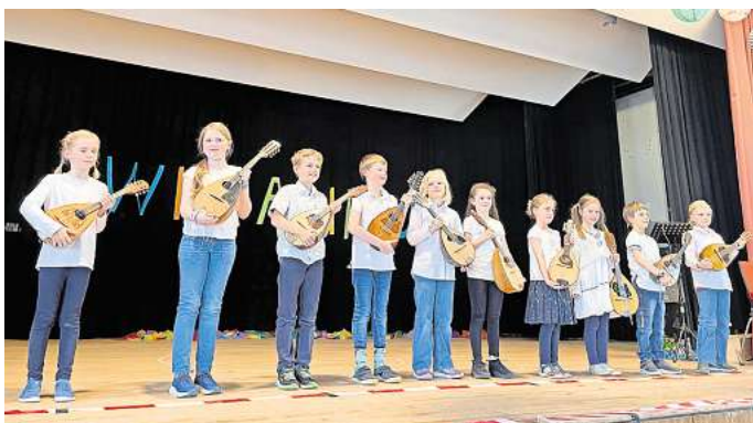
Premiere: Zum ersten Mal ist beim Projekt „Wir machen Musik“ auch eine Mandolinengruppe dabei.