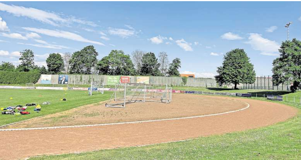
Platz für Hallensportarten: Hinter dem Rasenplatz soll auf der Bezirkssportanlage eine Multifunktionsfeld angelegt werden.

SV Gehrden modernisiert Bezirkssportanlage – neuer Platz für 200.000 Euro