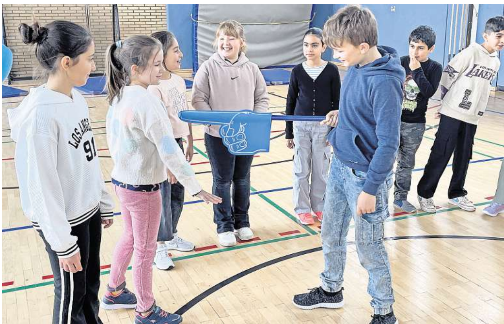
Stopp! Im Rahmen des "Social Skills"-Programms lernen die Kinder, wie sie sich körperlicher Gewalt und Respektlosigkeit erwehren können. Auf dem Bild "ärgert" ein Junge ein Mädchen, das diesen mit deutlichen Worten auffordert, damit aufzuhören.

Diese Entwicklung war lange Zeit auch an der AGS zu beobachten. Die Grundschule unterrichtet vergleichsweise viele Kinder mit Migrationshintergrund und aus sogenannten „bildungsfernen“ Familien. Deshalb bestä-