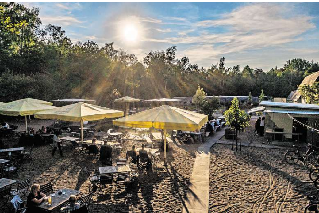
Idyllische Lage: Der Biergarten „Stiller's Bier im Garten 18 Grad“

Der älteste Biergarten: In Egestorf ist die Waldwirtschaft „Bärenhöhle“ seit mehr als 100 Jahren ein beliebtes Ausflugsziel für Wanderer, Spaziergänger und Fahrradfahrende. „Der Standort unmittelbar am Waldrand des Deisters liegt mitten im Grünen“, beschreibt Gastronomin Sabrina Schimpke die idyllische Lage. Ihr Lokal gibt es schon seit 1922, Schimpke ist seit 14 Jahren die Chefin. Sie hebt aber auch hervor: „Es ist kein reines Ausflugslokal, es gibt auch ein anspruchsvolles Angebot à la carte.“ Es gibt deutsche Küche und saisonale Gerichte. „Ohne Reservierung kann es aber schwierig werden“, sagt die Inhaberin. Sie rät, besser vorher einen Tisch zu bestellen. In der „Bärenhöhle“ wird als Bier unter anderem Gilde Ratskeller gezapft: 0,3 Liter für 3,40 Euro und 0,5 Liter für 4,60 Euro. Mit Calenberger Landbier steht auch ein regionales Biopils auf