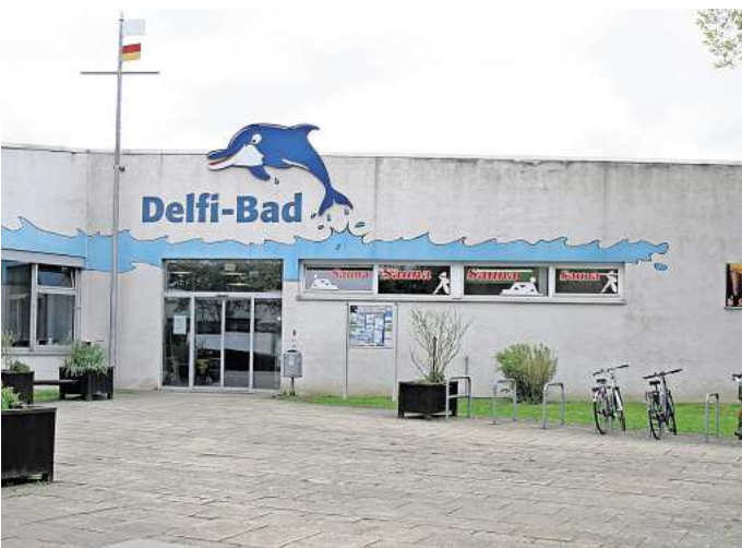
Die Vorbereitungen laufen auf Hochtouren: Auch der Bauhof Gehrden unterstützt die Mitarbeiter des Delfi-Bads.

Nun sind die Temperaturen tatsächlich gestiegen, doch wann genau es losgeht mit dem Badebetrieb auf dem Gelände an der Lange Feldstraße, kann er noch nicht verlässlich sagen. Der Schwimmmeister kalkuliert mit einer Öffnung des Freibads am 15. Mai. Die Vorbereitungen auf die Freiluftsaison laufen derzeit jedenfalls auf Hochtouren. Weil der endgültige Termin vage ist, musste das Delfi-Team