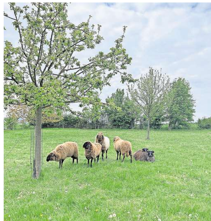
Auf der Streuobstwiese: Das sind nur einige Schafe aus der Herde des Schäfers Samuel Holmer.

Die Ergebnisse durch das Gras der Schafe werden von Gisela Wicke durch Kartierungen der Pflanzen vor und nach der Beweidung dokumentiert. Durch dieses Monitoring könnten Erkenntnisse für weitere Kalkmagerrasenflächen gewonnen werden, erläutert die Nabu-