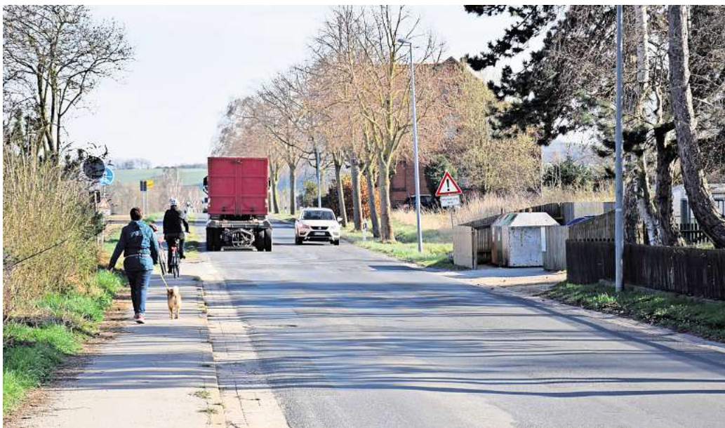
Ortseinfahrt: Vor allem die gerade Strecke, die aus Richtung Vörie nach Weetzen herein führt soll mit dem neuen Tempolimit entschärft werden.