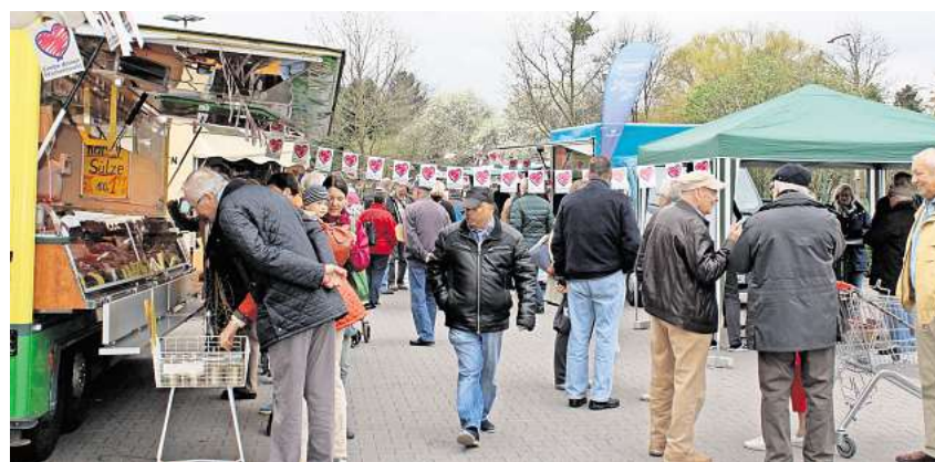
Guter Start: Beim Auftakt für den Wochenmarkt auf dem Rewe-Parkplatz waren im April 2017 viele Ronnenberger nach Empelde ge- kommen.

Nach der Premiere mit mehreren Tausend Besucherinnen und Besuchern im vergangenen Jahr findet auch 2024 wieder die Wenninger Klimamelle, Sonntag, 26. Mai statt. „Lust auf gutes Klima!“ – so lautet das Motto des zweiten Straßenfestes, das die Gemeinde Wenningen zusammen mit Wenningen for Future und der Marien-Petri-Kirchengemeinde vorbereitet. Von 11 bis 18 Uhr informieren mehr als 30 Vereine und Verbände sowie Initiativen auf dem Forges-Les-Eaux-Platz über alle Themenbereiche der Energiewende. Chöre und Bands sorgen für Stimmung, es gibt kulinarische Angebote und für Kinder gibt es Spiel- und Bastelaktionen.