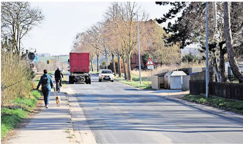
Ortseinfahrt: Vor allem die gerade Strecke, die aus Richtung Vörie nach Weetzen herein führt soll mit dem neuen Tempolimit entschärft werden.