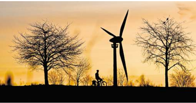
Beeinträchtigung bei der Aussicht: Viele Anwohner stören sich an Windrädern in der Aussicht an ihrem Wohnort.