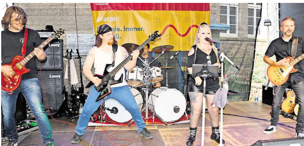
Live-Konzert: Die Band Hotblooded heizt am heutigen Sonnabend dem Publikum in der Kultkneipe „Tenne“ ein.