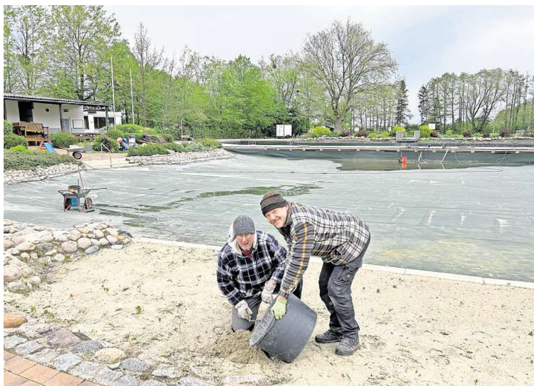
Noch gibt es viel zu tun: Im Wasserpark Wennigsen laufen die letzten Instandsetzungsarbeiten. Am 18. Mai wird die Saison im Naturbad eröffnet.

Im Außenbereich wartet hingegen noch mehr Arbeit. „Nachpflanzungen in den Beeten, Un-