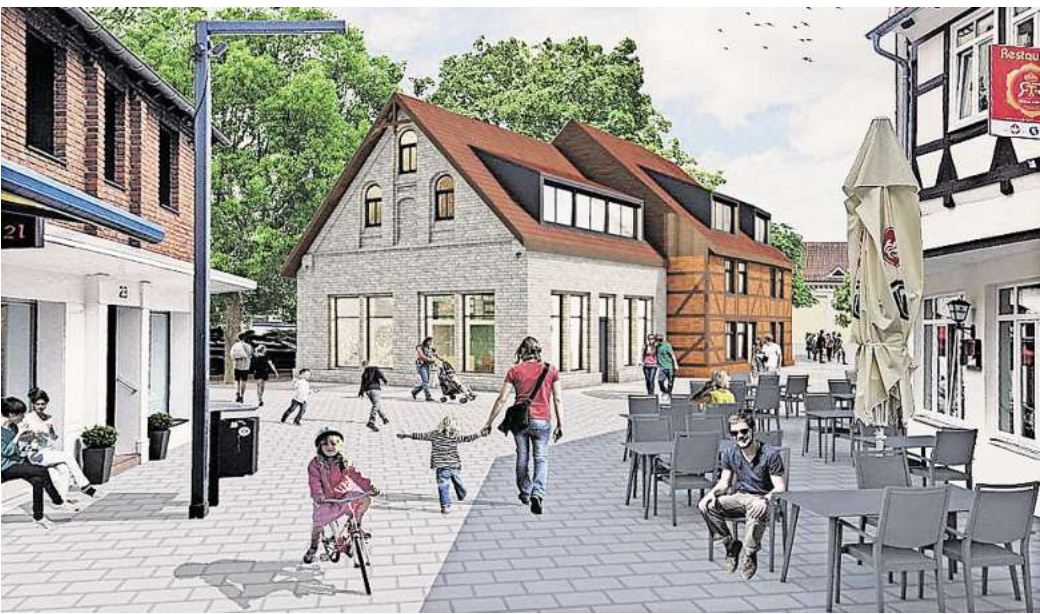
Blick in die Zukunft: So in etwa könnte das umgestaltete Haus am Steinweg 25 am Steinweg eines Tages aussehen.

Die Investoren arbeiten mit dem hannoverschen Büro Pfitzner Moorkens Architekten zusammen. Es sei ein schwieriges Ob-