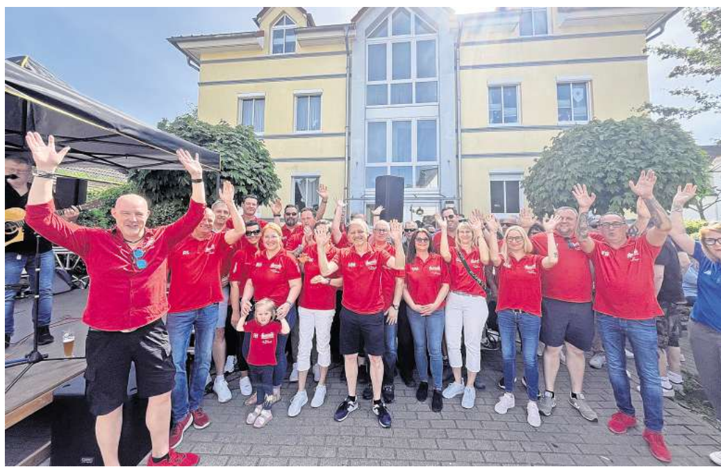
Die Vorfreude steigt: Beim traditionellen Biergarten-Opening im „Bierlokal Max“ wurde auch das Programm für das 52. Barsinghäuser Stadtfest bekannt gegeben.