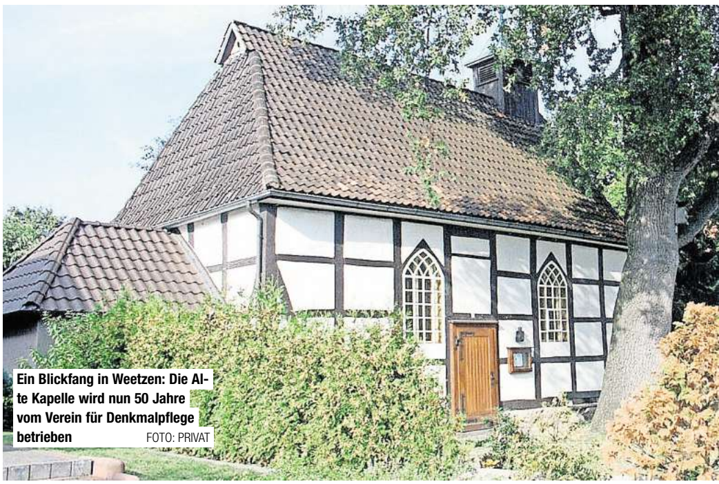
Ein Blickfang in Weetzen: Die Alte Kapelle wird nun 50 Jahre vom Verein für Denkmalpflege betrieben