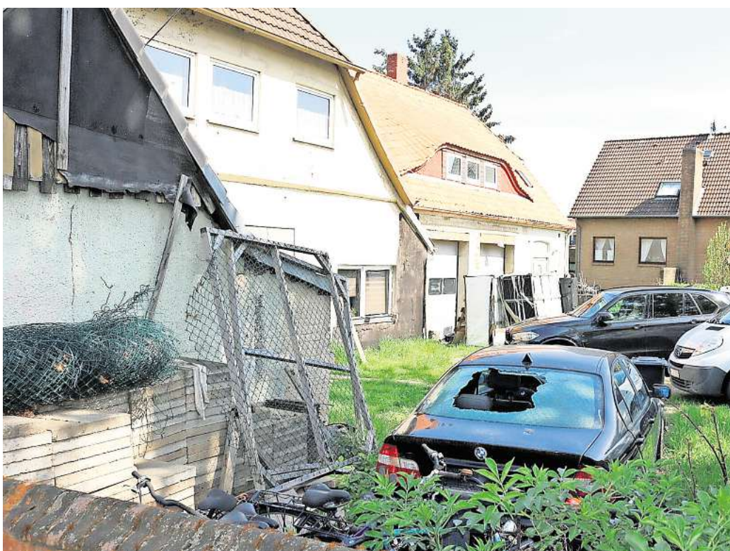
Blick aufs Nachbargrundstück: Auch dort stehen mehrere Autos – eins davon ohne gültige Zulassung und mit kaputter Heckscheibe.

Die Bewohner aus dem umstrittenen Haus fühlen sich zu Unrecht beschuldigt. Eine Frau nimmt in gebrochenem Deutsch Stellung zu den Vorwürfen aus der Nachbarschaft. Sie sagt, dass sie die Lärmbeschwerden für übertrieben halte. In dem