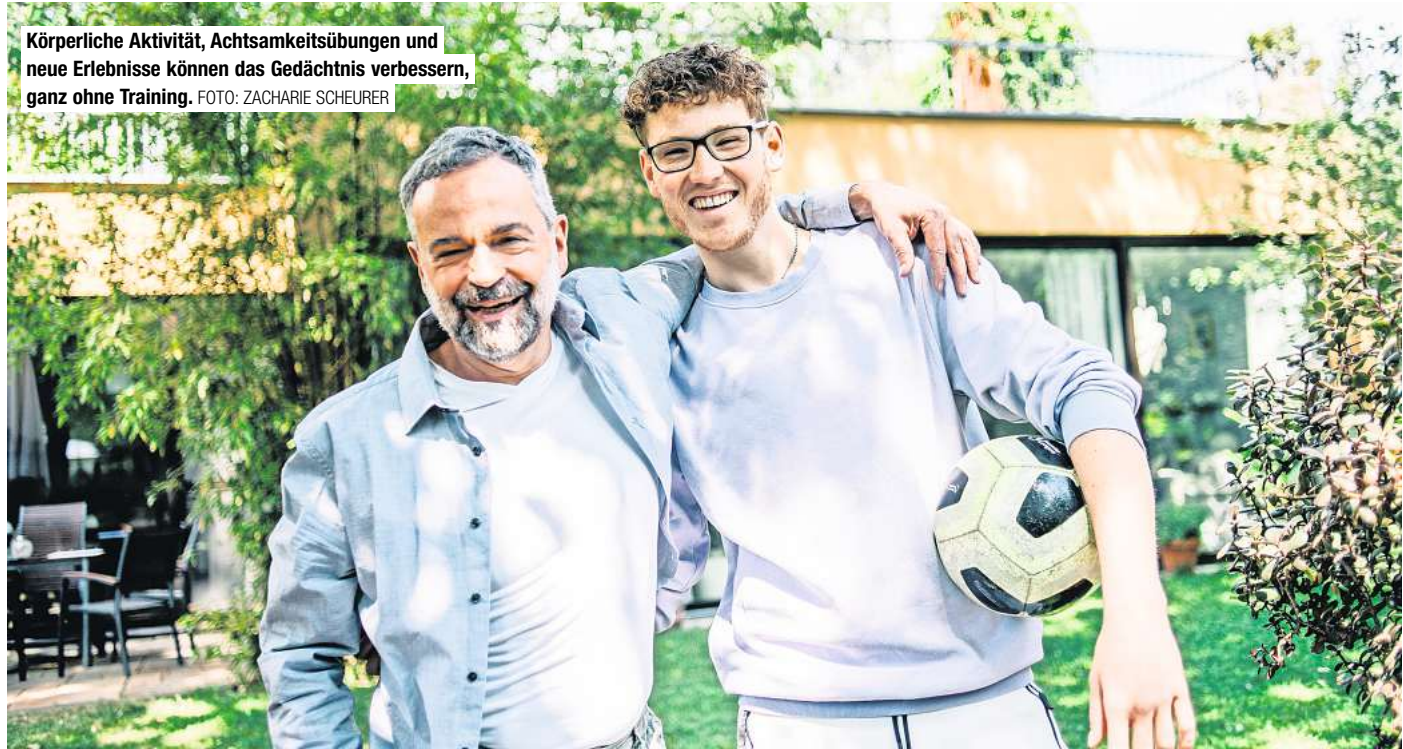
Körperliche Aktivität, Achtsamkeitsübungen und neue Erlebnisse können das Gedächtnis verbessern, ganz ohne Training.

heißt, Informationen, die uns helfen, uns in einer unsicheren und sich ständig verändernden Welt zurechtzufinden“, so der Psychologie-Professor.