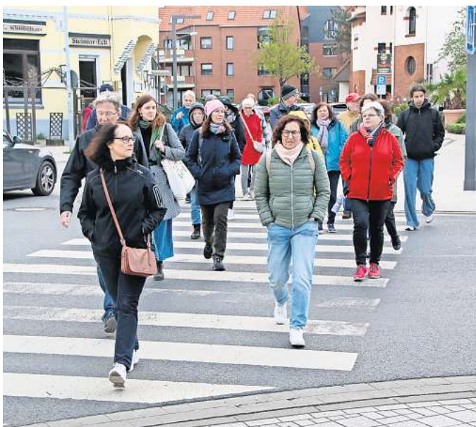
Rundgang: Zahlreiche Gehrdeninnen und Gehrdenen beteiligen sich am Fußverkehrs-Check. Hier überqueren sie den Zebrastreifen an der Nordstraße. Einige Teilnehmer würden sich den Übergang lieber an einer anderen Stelle der Straße wünschen.