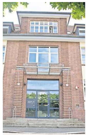
Handlungsfähigkeit im Rathaus: Die Kommunalaufsicht hat die Haushaltssatzung der Stadt Ronnenberg genehmigt.

Die Haushaltssatzung und der Haushaltsplan 2024 werden nach Veröffentlichung und Auslegung voraussichtlich am 17. April rückwirkend in Kraft treten, erwartet Frank Schulz.