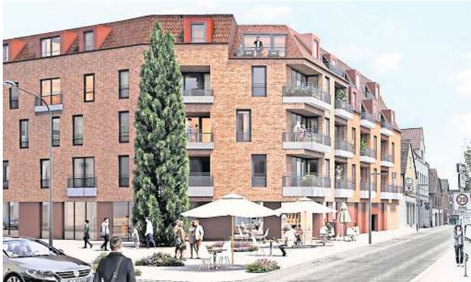
Entwurf: So in etwa könnte das geplante mehrgeschossige Wohnhaus am Steintor aussehen.

Stellplatzfrage sei bis zu einem Maximum hochgetrieben wor-den. Die Bauherren müssten nun schauen, wie weit sie in die Tiefe gehen könnten, um möglichst vie-le Parkplätze einrichten zu kön-nen. Losert sagte, er hätte sich gewünscht, dass bei diesem Wohnprojekt für ältere Menschen der Nahverkehr und das Carsha-ring-Angebot in der Stadt mehr Berücksichtigung gefunden hät-