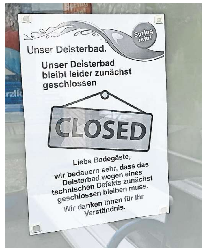
Unendliche Geschichte? Seit Wochen finden Besucher des Deisterbads keine offene Tür, sondern nur einen Aushang, dass das Bad weiterhin geschlossen bleibt.

Das habe dazu geführt, dass ein Großteil der notwendigen Such- und Reparaturmaßnahmen eines Vorgehens bedurften, das nur Spezialfirmen unter Verwendung von ganz speziellen Hilfsmitteln und Materialien durchführen können. „Wir haben wirklich große Schwierigkeiten gehabt“, klagt der Badmanager. Auch jetzt habe sich wieder bestätigt, dass der Wasser-