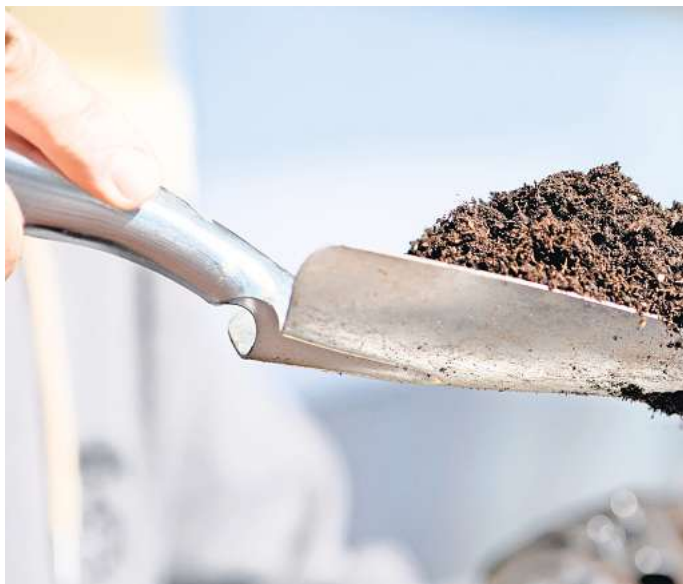
Erde mit Kokosfasern, Rindenmulch oder Kompost bietet eine umweltfreundliche Alternative zu torfhaltiger Erde.

Der Torfabbau schadet einem wichtigen Ökosystem. Denn Torfmoore speichern Kohlenstoff und bieten Lebensräume für verschiedene Pflanzen- und Tierarten. Bei der Gewinnung werden Sie entwässert und setzen Treibhausgase frei. Torf ist außerdem kein nachwachsender Rohstoff.