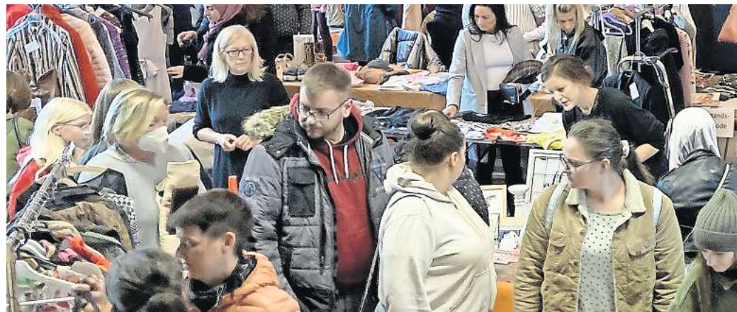
Auftakt: In Gehrden beginnt im April auf dem Marktplatz die Flohmarktsaison

Ebenfalls am heutigen Sonnabend, 6. April, tritt um 19 Uhr im Jugendpavillon (Jupa) die Band Close Together auf. Das Ensemble der Calenberger Musikschule präsentiert im Jupa an der Langen Feldstraße unter anderem Welthits. Die sechsköpfige Gruppe ging im Jahr