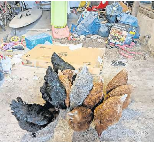
Verwahrlo- sung: Die 20 Hühner lebten zuletzt in un- gepflegten Stallungen. Im Hinter- grund ist das Chaos zu erkennen, das die Halterin bei ihrem Auszug zurückließ.