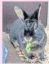
Suse fühlt sich vorerst wohl im Kleintierhaus.

Kleintierteam engagiert und flexibel und so konnten wir alle Tiere retten. Da die Weibchen mit einem unkastrierten Bock zusammen saßen, stellen wir uns auf noch mehr Nachwuchs ein. Natürlich sind die Tiere noch nicht zu vermitteln, aber Interessenten können gern schon Kontakt aufnehmen. Insgesamt sind es vier erwachsene Tiere, drei Kinder sind etwa 10 Wochen jung, drei weitere Tiere etwa 4 bis 5 Wochen und die Jüngsten sind gerade