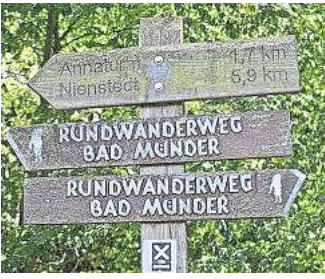
Wanderwegweiser im Deister: Wie kann man mehr aus dem Höhenzug machen?

„Wir hatten das noch nicht gleich am Anfang gemacht, vor dem Hintergrund, dass wir zuerst mal unsere Einwände geltend gemacht haben. Und dann gab es ja eine Infoveranstaltung in Gehrden, bei der wir auch waren“, berichtet Klokemann.