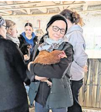
Gerettet! Helfer und Helferinnen des Tierschutzvereins Barsinghausen "sammeln" die zurückgelassenen Hühner ein.