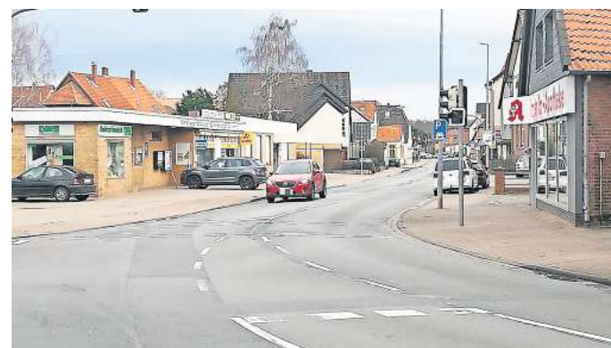
Sanierung: Wegen der schlechten Oberfläche soll die Straße Ihmer Tor überplant werden. Ob dabei auch einer Verkehrsberuhigung herauspringt, ist noch nicht geklärt.

„Die K233 in der Ortsdurchfahrt Ronnenberg wird seitens der Region Hannover aufgrund des Straßenzustandes und der Radverkehrsführung überplant“, bestätigt Regionssprecher Christoph Borschel. Man sei aber erst dabei, die Grundlagen