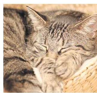
So sieht eine zufriedene Katze aus.

In solchen Fällen ist ein Haus-sitter oder ein für mehrere Stunden anwesender Catsitter die beste Lösung. Ist dies nicht möglich, bietet sich die Unterbringung in einer Katzenpension an. Dabei sollte die Unterbringung unbedingt katzensgerecht und