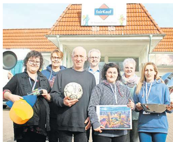
Das fairKauf-Team freut sich auf zahlreiche Besucher.

Auf einer Verkaufsfläche von rund 460 Quadratmetern bietet der Secondhand-Experte aus Hannover im Heisterweg in Wennigsen ab 4. April unter anderem Haushaltswaren, Elektrokleinge-