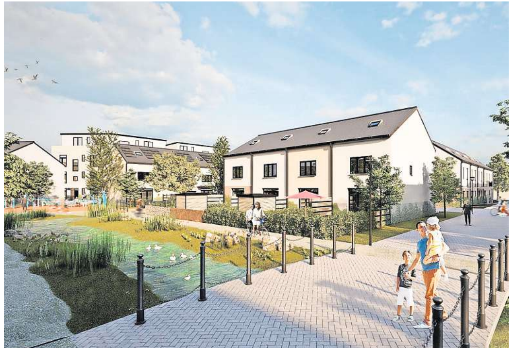
Neues Gesicht: So stellt sich der Investor Deutsche Siedlungsbau das geplante Wohngebiet Humboldtquartier vor.

Regiobus-Betriebshof, Schule, Wohnungsbau: Kein anderer Stadtteil Ronnenbergs verändert sich so stark