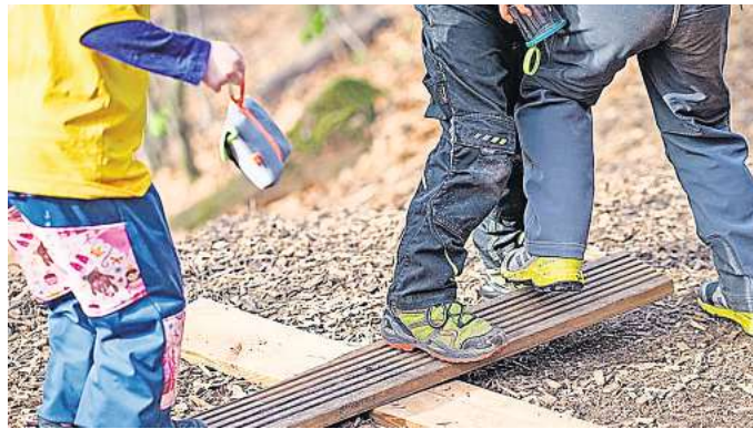
Richtige Kleidung zwingend erforderlich: Jungen und Mädchen aus Waldkindergärten kommen selten sauber nach Hause.

Bei der Unteren Naturschutzbehörde der Region liegt derzeit ein Antrag der Stadt Ronnenberg auf eine Sondergenehmigung für den Standort des Waldkindergartens vor. Denn die anvisierte Fläche liegt in einem Landschaftsschutzgebiet im Ronnenberger Holz. „Wir haben uns mit dem Standort gemeinsam mit dem