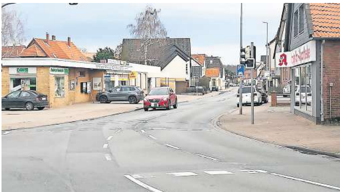
Sanierung: Wegen der schlechten Oberfläche soll die Straße Ihmer Tor überplant werden. Ob dabei auch einer Verkehrsberuhigung herauspringt, ist noch nicht geklärt.

„Die K233 in der Ortsdurchfahrt Ronnenberg wird seitens der Region Hannover aufgrund des Straßenzustandes und der Radverkehrsführung überplant“, bestätigt Regionssprecher Christoph Borschel. Man sei aber erst dabei, die Grundlagen