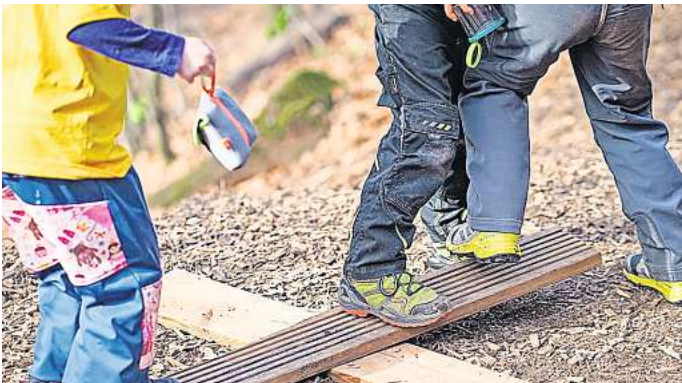
Richtige Kleidung zwingend erforderlich: Jungen und Mädchen aus Waldkindergärten kommen selten sauber nach Hause.

Bei der Unteren Naturschutzbehörde der Region liegt derzeit ein Antrag der Stadt Ronnenberg auf eine Sondergenehmigung für den Standort des Waldkindergartens vor. Denn die anvisierte Fläche liegt in einem Landschaftsschutzgebiet im Ronnenberger Holz. „Wir haben uns mit dem Standort gemeinsam mit dem