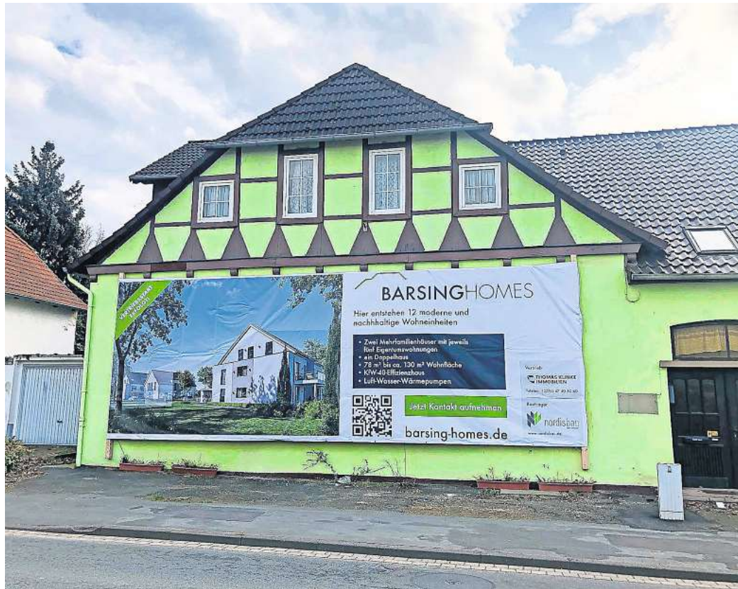
Wird bald abgerissen: In der über 100 Jahre alten Immobilie war bis Ende 2022 eine Gastwirtschaft. Das Witsehepaar ging in den Ruhestand und das Deutsche Haus an der Egestorferstraße steht seit dem leer.

Der Abriss des über 100 Jahre alten Gebäudes an der Stoppstraße startet im Spätsommer