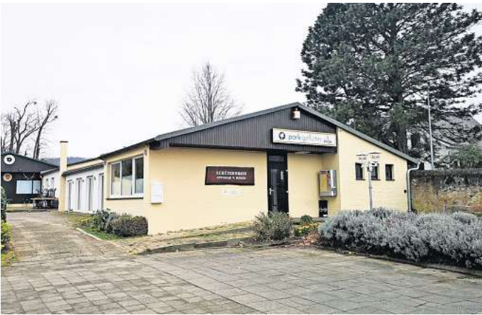
Ein neuer Bebauungsplan wird erstellt: Der Gastronomiebetrieb im Schützenhaus ist wegen fehlender Genehmigungen seit zweieinhalb Jahren untersagt. Das soll sich bald ändern.

Zur Vorgeschichte: Das Schützenhaus hat sich seit Anfang der 1980er-Jahre als Schießstand mit angegliederter Gaststätte entwickelt und stellte in den Sommermonaten ein beliebtes Angebot für Besuchende des Ottomar-von-Reden-Parks dar. Doch Gastronomie hätte dort gar nicht betrieben werden