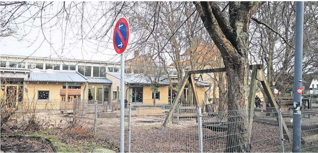
Integrativer Schwerpunkt: Nur in der Kita Am Castrum werden Jungen und Mädchen mit Handicap betreut.

„Die Nerven liegen blank“, sagt eine Mutter, deren dreijähriger