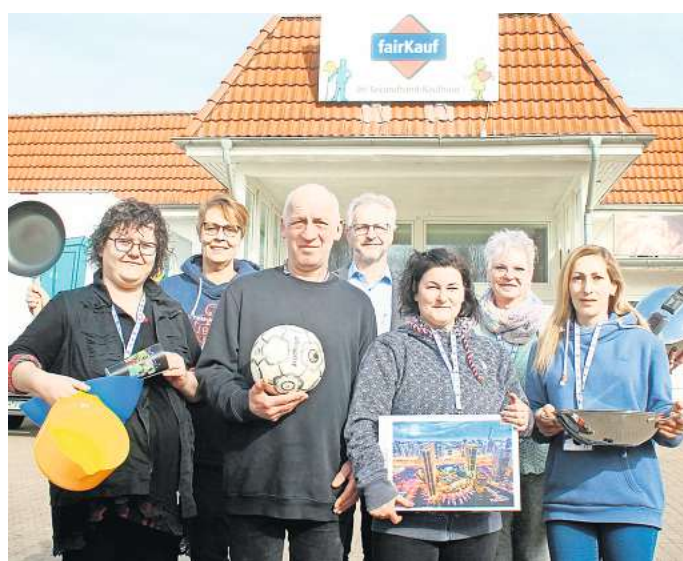
Das fairKauf-Team freut sich auf zahlreiche Besucher.

Auf einer Verkaufsfläche von rund 460 Quadratmetern bietet der Secondhand-Experte aus Hannover im Heisterweg in Wennigsen ab 4. April unter anderem Haushaltswaren, Elektrokleinge-