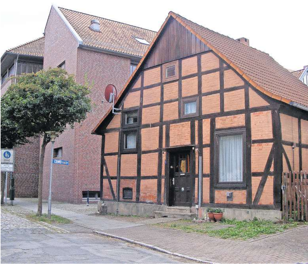
Günstiger Standort: Die Stadt Gehrden will ein unbewohntes Haus an der Hüttenstraße abreißen, um dort eine Außenstelle für das Rathaus einzurichten.

Doch in den vergangenen Jahren ist die Mitarbeiteranzahl im Rathaus weiter gestiegen. Aus diesem Grund hatte die Stadt für die Büroräume der Mitarbeiterinnen und Mitarbeiter Wohnungen in umliegenden Gebäuden angemietet – was mit einem entsprechenden Kostenaufwand einherging. Aus logistischen und organi-