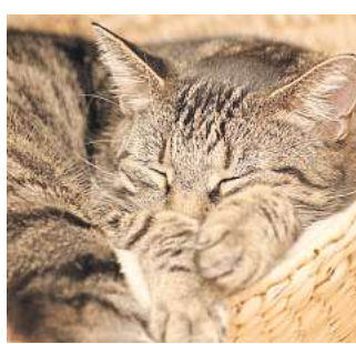
So sieht eine zufriedene Katze aus.

In solchen Fällen ist ein Haus-sitter oder ein für mehrere Stunden anwesender Catsitter die beste Lösung. Ist dies nicht möglich, bietet sich die Unterbringung in einer Katzenpension an. Dabei sollte die Unterbringung unbedingt katzengerecht und