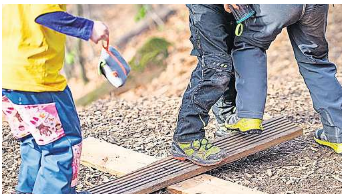
Richtige Kleidung zwingend erforderlich: Jungen und Mädchen aus Waldkindergärten kommen selten sauber nach Hause.

Ronnenberg. Matschhose und wetterfeste Schuhe gehören eigentlich das ganze Jahr über dazu: In einem Waldkindergarten halten sich Mädchen und Jungen ab drei Jahren vor allem im Freien auf. Sauber kommen die Kids danach nur selten nach Hause. Die besonderen Erfahrungen der Kinder in der Natur und die speziellen pädagogischen Konzepte, mit denen diese Einrichtungen arbeiten, bewegen aber dennoch – oder vielleicht gerade deshalb – viele Eltern, ihren Nachwuchs in einem Waldkindergarten anzumelden. Auch die Stadt Ronnenberg versucht seit einiger Zeit, ihr Betreuungsangebot um diese pädagogische Variante zu erweitern. Das Signal für den Start muss nun aber die Region Hannover erteilen. Bei der Unteren Naturschutzbehörde der Region liegt derzeit ein Antrag der Stadt Ronnenberg auf eine Sondergenehmigung für den Standort des Waldkindergartens vor. Denn die anvisierte Fläche liegt in einem Landschaftsschutzgebiet im Ronnenberger Holz. „Wir haben uns mit dem Standort gemeinsam mit dem