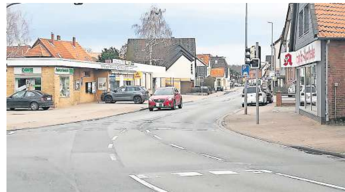
Sanierung: Wegen der schlechten Oberfläche soll die Straße Ihmer Tor überplant werden. Ob dabei auch einer Verkehrsberuhigung herauspringt, ist noch nicht geklärt.

Während der Diskussionen im Rat über die Ortskernsaniierung im Ortsteil Ronnenberg war im Februar der Hinweis gefallen, dass bei den Planungen zur Straße Lange Reihe mit der Buswendeschleife die Umgestaltung der Straße Ihmer Tor abgewartet und einbezogen werden soll. Für Ihmer Tor als Kreisstraße 233 ist die Region Hannover zuständig. Dort haben die Planungen für eine neue Gestaltung der Straße bereits begonnen. „Die K233 in der Ortsdurchfahrt Ronnenberg wird seitens der Region Hannover aufgrund des Straßenzustandes und der Radverkehrsführung überplant“, bestätigt Regionssprecher Christoph Borschel. Man sei aber erst dabei, die Grundlagen