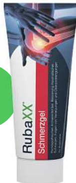
Rubaxx Schmerzgel (PZN 18709526)