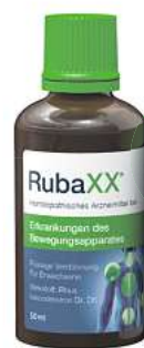
Rubaxx Tropfen (PZN 13588561)