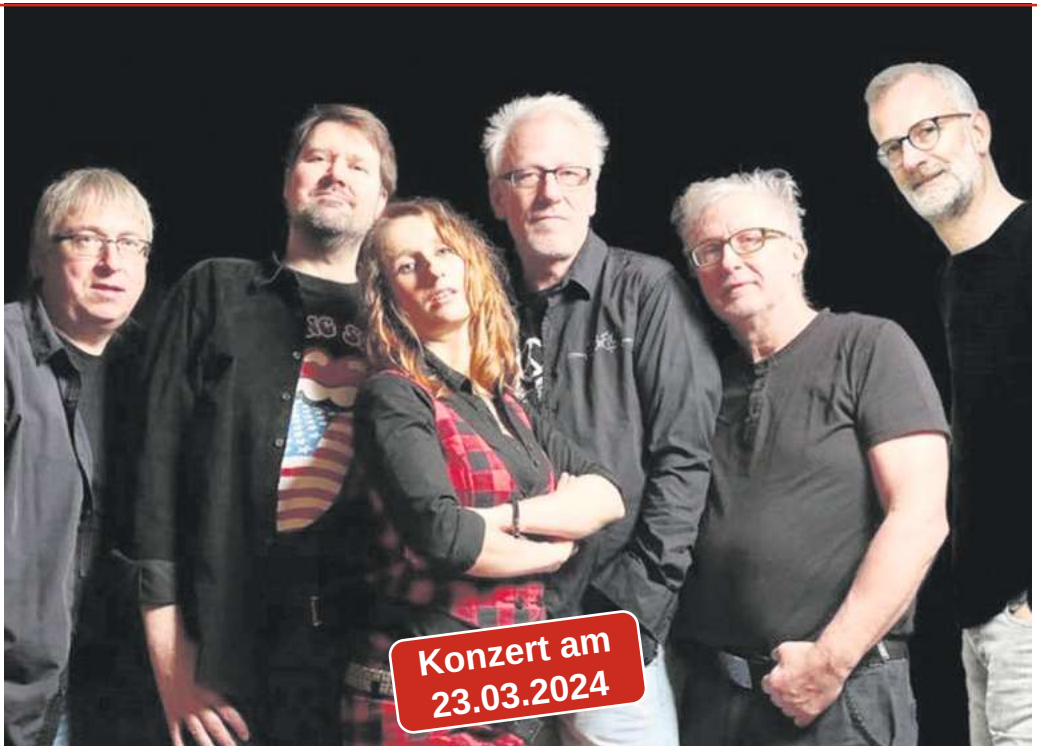
Konzert am 23.03.2024