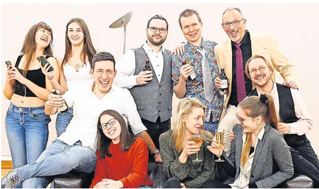
Vorfreude: Das Ensemble für „Das perfekte Geheimnis“ probt seit Dezember. Premiere ist am 22. Juni. Die beiden anderen Stücke der diesjährigen Saison der Deister-Freilicht-Bühne sind „Pinocchio“ und „Im weißen Rössl“.