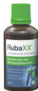
Rubaxx Tropfen (PZN 13588561)