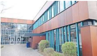
Neue Schulform: Die Oberschule, an die auch eine Grundschule angegliedert ist, wird ab dem nächsten Schuljahr zu einer IGS.

Start bereits zum nächsten Schuljahr – Verwaltung hofft auf Entlastung im Gymnasium