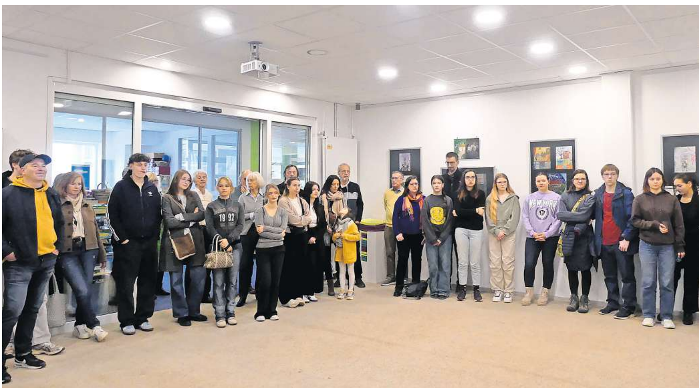
Großes Interesse: Zahlreiche Gäste kommen zur Ausstellungseröffnung in den Mehrgenerationentreff.

Die Kunst-Leistungskurse der Schule widmeten sich zur Abiturvorbereitung dem Thema „Illustration“. Dabei interpretierten sie auf bildnerische Weise zwei Kurzgeschichten: „Die Wirtin“ von Roald Dahl und „Heimkehr“ von Franz Kafka. Die Schülerinnen und Schüler versuchten mit ihren Zeichnungen, Gemälden und Collagen das auszudrücken, was die Prosa an inneren Bildern bei ihnen weckte – mal düster und elegant, mal verstö-