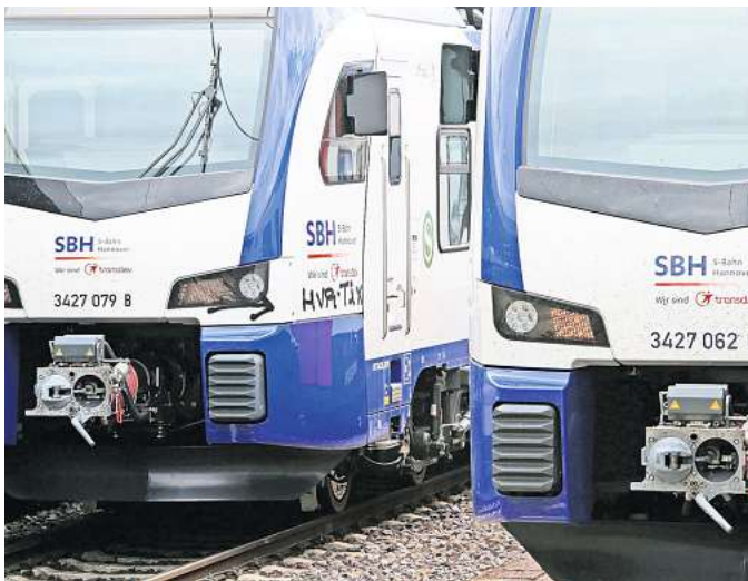
Mehr Fahrten für Wennigsen: Der neue Fahrplan der S-Bahn sieht ab 2025 Verbesserungen für die Pendler in der Gemeinde vor.

Mehr Verbindungen für Fahrgäste am Wochenende sind genauso geplant wie eine neue Expresslinie im Berufsverkehr