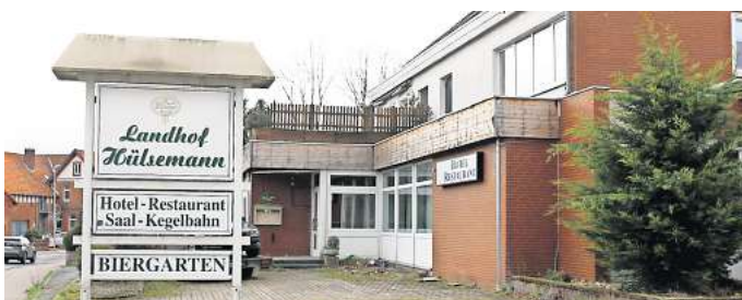
Abriss und Neubaupläne aufgeschoben: Das Gebäude des früheren Landhofes Hülsemann in Groß Munzel soll nun doch zunächst noch einmal als Hotelrestaurant verpachtet werden, bevor das Bauunternehmen BSA Construct GmbH als Grundstückbesitzer am gleichen Standort Einfamilien- und Doppelhäuser errichten will.

Dabei sind die Neubaupläne des Investors schon sehr konkret. Laut BSA-Mitarbeiter Özgör sollen auch weiterhin zu einem noch unbestimmten Zeitpunkt Einfamilien- und Doppelhäuser auf dem Grundstück an der Dammstraße gebaut und dann verkauft werden. „Es liegt auch eine Baugenehmigung vor, die sich ver-