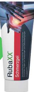
Rubaxx Schmerzgel (PZN 18709526)