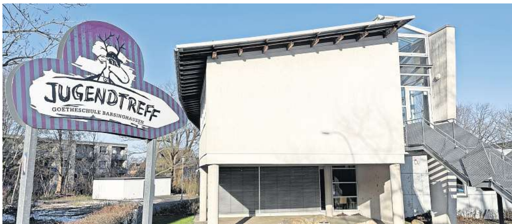
Jugendtreff Barsinghausen: Das Personal der Einrichtung wird aufgestockt.