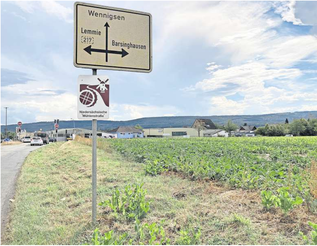
Zentraler Standort: Auf dem Pinnenheister-Flurstück nahe der Möllerburg-Kreuzung, zwischen Bönninger Straße und Danquardstraße, soll das neue Feuerwehrhaus entstehen.

Degersen. Die Pläne sind da, doch die Umsetzung dauert noch: In Wennnigsen soll auf dem Pinnenheister neben einem neuen Feuerwehrhaus auch eine neue Gewerbefläche entstehen. Für das Gebiet an der Möllerburg-Kreuzung hat die Gemeinde bereits 2020 die notwendige Änderung des Flächennutzungsplans beschlossen. Doch die konkrete Umsetzung lässt noch auf sich warten. „Das Areal ist immer wieder Thema, aber noch nicht spruchreif“, sagt Wirtschaftsförderer Remo Gaubatz. Mit 20.000 Quadratmetern ist die Fläche auf dem Pinnenheister eher klein. Für ein neues Feuerwehrhaus und ein kleines Gewerbegebiet ist dort laut Flächennutzungsplan trotzdem Platz: Das Feuerwehrhaus soll auf einem Eckgrundstück zwischen Bönninger Straße und Danquardstraße gebaut werden. Rund 4300 Quadratmeter sind laut Bebauungsplan dafür vorgesehen. Etwa 14.000 Quadratmeter will die Gemeinde als Gewerbegebiet nutzen. Die Gewerbefläche ist nur für sogenannte nicht wesentlich störende Betriebe vorgesehen – das sind Firmen, die nicht vor Ort produzieren und somit besonders geräusch- und geruchsarm sind. Entsprechende Interessenten seien bereits vorhanden, Bewerbungen kämen herein, sagt Gaubatz. Doch es gebe ein strukturelles Problem: Bislang sei nur eine einseitige Erschließung der Fläche vorgesehen – konkret bedeutet das, dass das Feuerwehrgebäude und das angrenzende Gewerbegebiet nur über eine Sackgasse erreicht werden könnten, die von der Danquard-