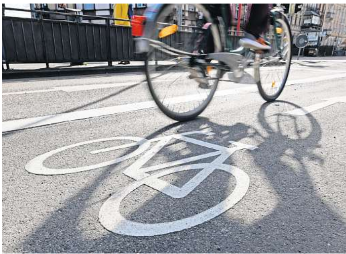
Radschnellweg geplant: Radfahrer sollen bald schnell und sicher von Gehrden nach Hannover kommen.

Ab März sollen die Streckenverläufe online einsehbar sein, dann können Bürgerinnen und Bürger sich an dem Verfahren beteiligen, indem sie die Routen bewerten und kommentieren. Im Spätsommer soll dann eine zweite Auswahlrunde folgen. Dann sollen die Hinweise ausgewertet werden und die Radstrecken konkreter bestimmt werden.