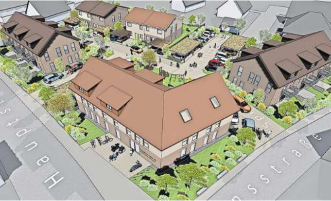
Baupläne für Großgoltern: Auf dem Grundstück eines früheren landwirtschaftlichen Hofes soll ein Mehrgenerationen-Quartier entstehen.

Eine Voraussetzung gibt es: Um das Projekt zu verwirklichen, ist eine Änderung des Bebauungsplanes erforderlich. Der ehemalige landwirtschaftliche Betrieb existiert zwar nicht mehr – und es gibt laut Barsinghäuser