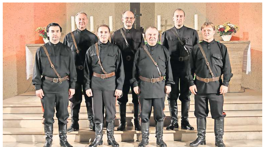
Treten am 17. März in Barsinghausen auf: Maxim Kowalews Don-Kosaken.

Tickets für das Konzert sind im Vorverkauf in Barsinghausen erhältlich im Bücherhaus am Thie (Marktstraße), im Reisebüro Gol-