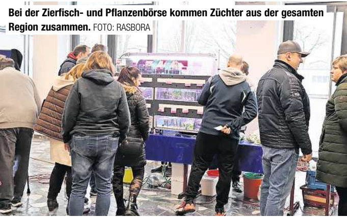
Bei der Zierfisch- und Pflanzenbörse kommen Züchter aus der gesamten Region zusammen.

Barsinghausen. Seine Zierfisch- und Pflanzenbörse veranstaltet die Rasbora Aquarien- und Terrariengesellschaft Barsinghausen am Sonntag, 10. März, von 15 bis 17 Uhr, in der Adolf-Grimme-Schule in Barsinghausen. Neben den vereinsinternen Züchtern bieten auch