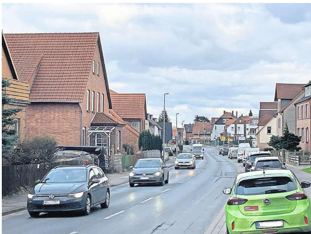
Viel befahren und marode: Die Landesstraße 391 ist insbesondere im Bereich der Egestorfer und der Stopfstraße in einem erbarmungswürdigen Zustand.

2022 sei vereinbart worden, dass die Stadtverwaltung die Landesbehörde, die unter Personalmangel litt, bei deren plane-