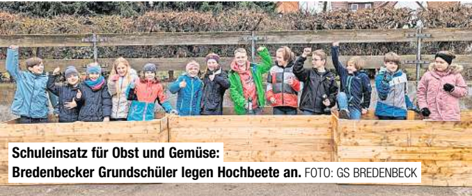
Schuleinsatz für Obst und Gemüse: Bredenbecker Grundschüler legen Hochbeete an.

Informationen zu den einzelnen Konzerten unter www.marien-petri-gemeinde-wennigsen.de sowie unter www.friedhof-wennigsen.de . Anmeldungen unter Telefon (05103) 925192.