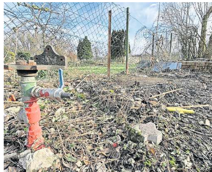
Abgerissen: Wo bis vergangenen Herbst noch Kleingärten waren, sind jetzt die Gebäude und ein Großteil der Bepflanzung verschwunden.

Mit den Gründen für die Räumung der Flächen hält die Son-