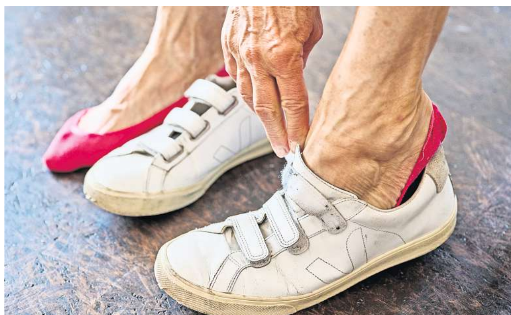
Diabetikerinnen und Diabetiker mit Nervenschäden sollten täglich ihre Füße auf Schwellungen, Rötungen oder andere Veränderungen untersuchen.

Sie sollten ihre Füße jeden Tag untersuchen: Sind sie geschwollen, gerötet oder warm? Hat sich die Haut verändert, sind da Druckstellen oder Blasen? Emp-