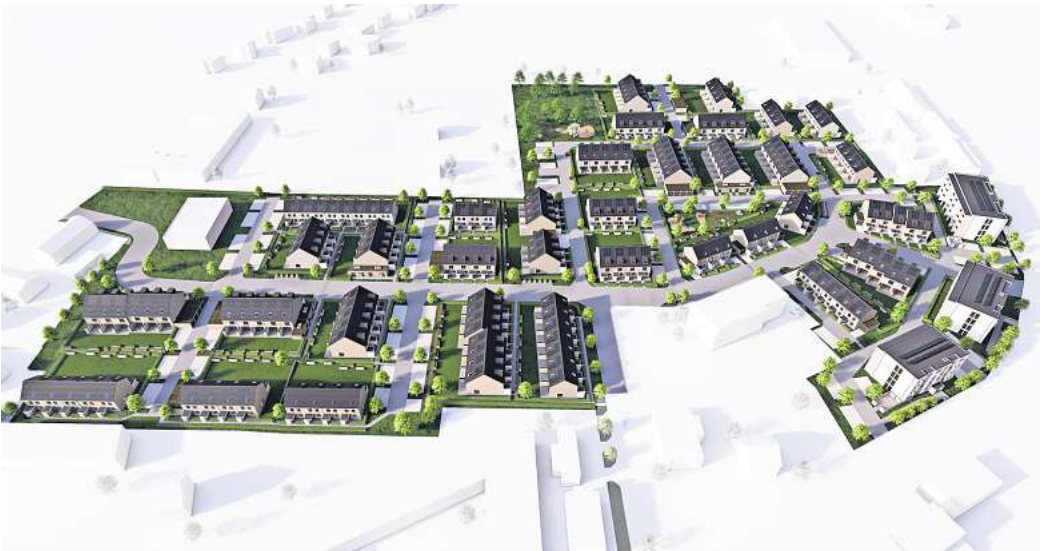
Ausblick: So wie in dieser Visualisierung soll das neue Wohnquartier Vorwerk eines Tages aussehen.

Bereits 2017 hat die DRH, die inzwischen deutschlandweit zu den Top 10 der Wohnungsentwickler zählt, die Brachfläche im Westen der Kernstadt erworben. Sieben Jahre später kommt jetzt Bewegung in das Projekt. Ursprünglich war der Baustart für Mitte 2022 geplant. Doch es gab Abstimmungsprobleme.