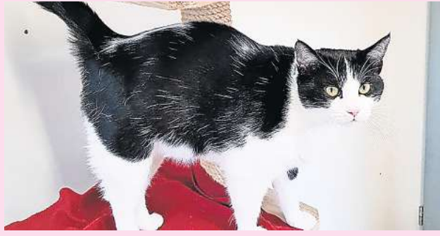
Irene ist kastriert, geimpft und gechipt.

Tierschutzverein Barsinghausen und Umgebung Ludwig-Jahn-Straße 11a 30890 Barsinghausen Telefon (05105) 7736777