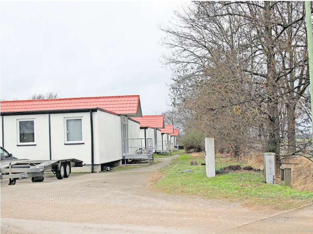
Standort zur Unterstützung: Das sind die Container für Flüchtlinge an der Empelder Straße.

„Zurzeit leben im Stadtgebiet 83 Personen in Wohncontainern.