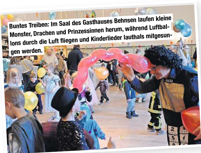
Buntes Treiben: Im Saal des Gasthauses Behnsen laufen kleine Monster, Drachen und Prinzessinnen herum, während Luftballons durch die Luft fliegen und Kinderlieder lauthals mitgesungen werden.

Dann geht die Feier richtig los: „Hier fliegen gleich die Löcher aus dem Käse, denn nun gehts sie los, uns're Polonaise“, schallt es