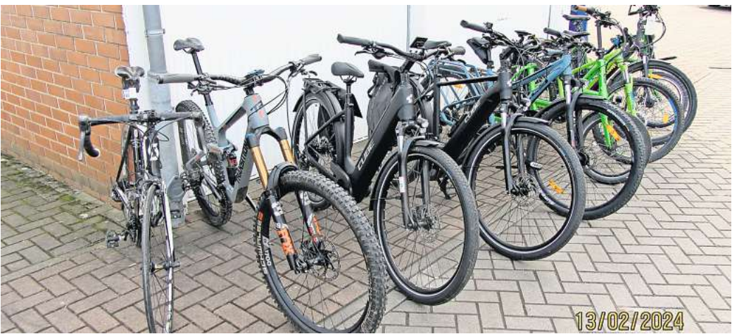
Diebesgut: Fahrräder im Wert von etwa 25.000 Euro hat die Polizei in der Nacht zu Dienstag sichergestellt.

Weitere Ermittlungen führten zu einem Mercedes-Transporter, welchen die beiden Täter am Bethovenring abgestellt hatten. In dem Fahrzeug fanden die Beamten neben „delikttypischem Aufbruchwerkzeug“ diverse hochwertige (Elektro-) Fahrräder und entwendetes Werkzeug. Eine erste Schätzung ergab einen Gesamtwert des aufgefundenen