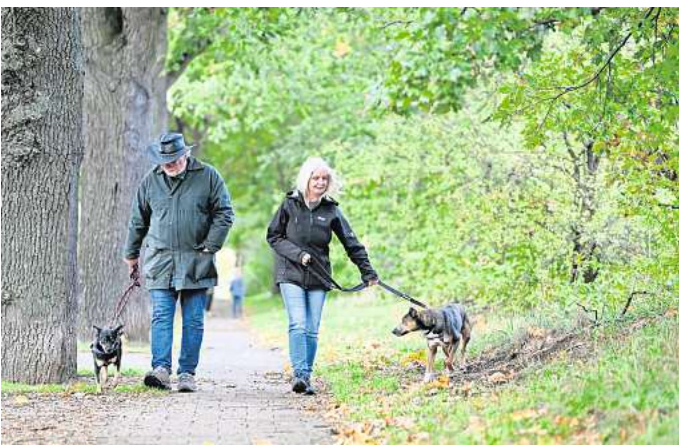
Etwa 2300 Hunde sind in Barsinghausen angemeldet: Insgesamt nimmt die Stadt jährlich etwa 340.000 Euro an Steuern mit Hunden ein.