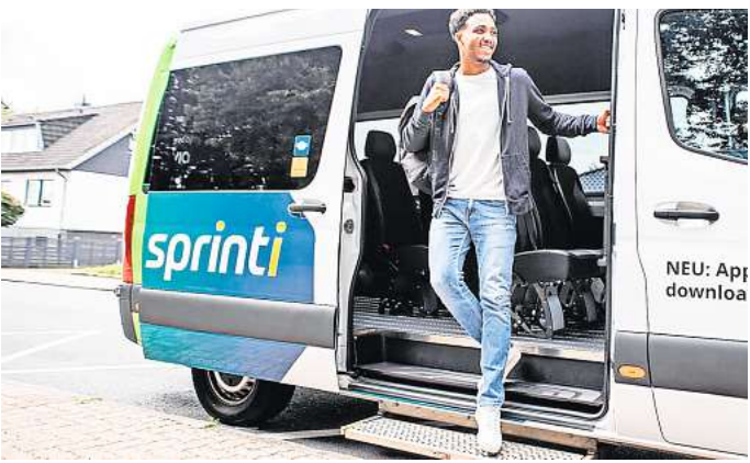
Der Rufbus sprinti fährt seit Dezember 2023 in 12 Umlandkommunen.

Region. Noch im Dezember 2023 gab es Rückenwind auf großer Bühne für Sprinti, den On-Demand-Bus der Region Hannover, der seit einigen Monaten den kompletten äußeren Ring des Umlandes bedient. Bundesverkehrsminister Volker Wissing (FDP) zeichnete das Projekt in der Kategorie „Good Practice“ mit dem Deutschen Mobilitätspreis aus. Dennoch soll schon Ende 2024 die Förderung des Bundes für das wichtige Verkehrswendevorhaben auslaufen. Regionpräsident Steffen Krach (SPD) übt scharfe Kritik. Die Region hatte darauf gehofft, dass es für das prämierte Projekt eine Anschlussförderung geben würde. Die ist derzeit nicht in Sicht. „Dass mit einem Preis und warmen Worten ein solches Leuchtturmprojekt und die Ver-