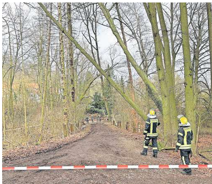
Die Feuerwehr hat die beiden Buchen inzwischen gefällt, der Waldweg blieb vorerst gesperrt.