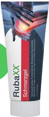
Rubaxx Schmerzgel (PZN 18709526)