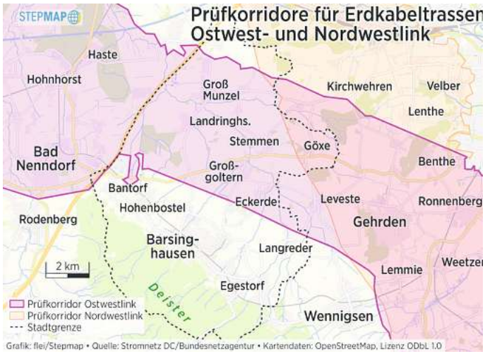
Prüfkorridore für Erdkabeltrassen Ostwest- und Nordwestlink

Tennet hat in einem etwa 1000 Meter breiten Korridor nach der optimalen Trasse gesucht. Dafür waren etwa Bodenuntersuchungen und Naturschutzgutachten erforderlich. Grundeigentümer wurden beteiligt, ebenso wie die Öffentlichkeit. Alles zum derzeitigen Stand der Planungen ist im Internet unter www.netzausbau.de zu finden.