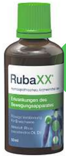
Rubaxx Tropfen (PZN 13588561)