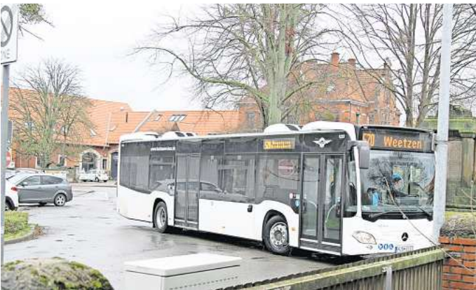
Mit finanzieller Unterstützung vom Land: Busse wie die 520 halten bislang auf einer Straßenseite der Haltestelle „Denkmal“ an einem Bedarfshalt. Dieser soll nun ausgebaut werden.

halten. In den nächsten zwei Jahren, innerhalb des Förderzeitraumes, sollen die Haltestellen fertiggestellt werden.